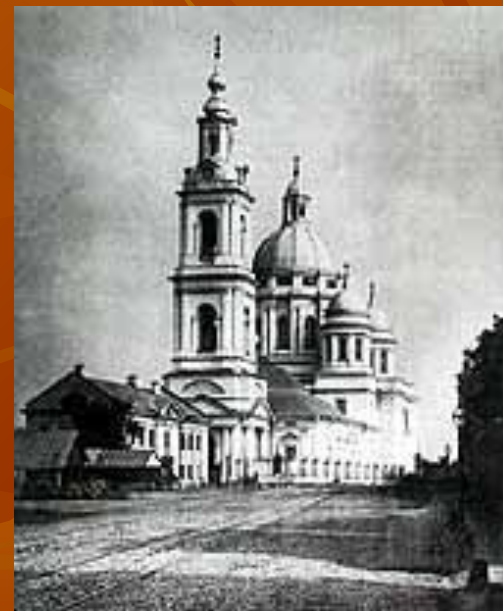
Елоховский собор, где крестили Пушкина

❖ О Москве, о том, что он родился в Москве, Пушкин всегда говорил с гордостью.