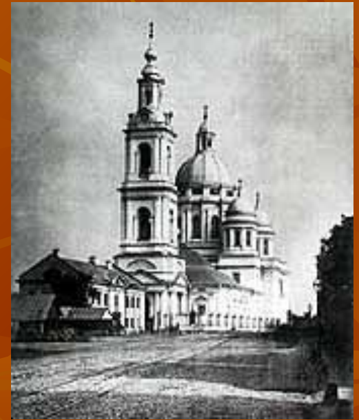
Елоховский собор, где крестили Пушкина

❖ О Москве, о том, что он родился в Москве, Пушкин всегда говорил с гордостью.