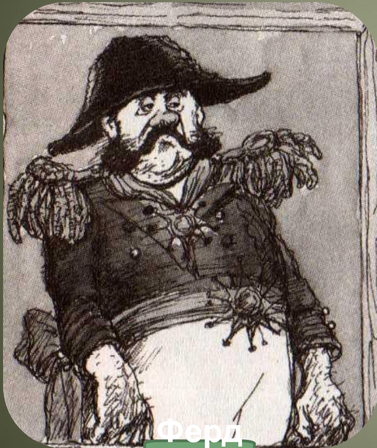
Ферд ыще нко