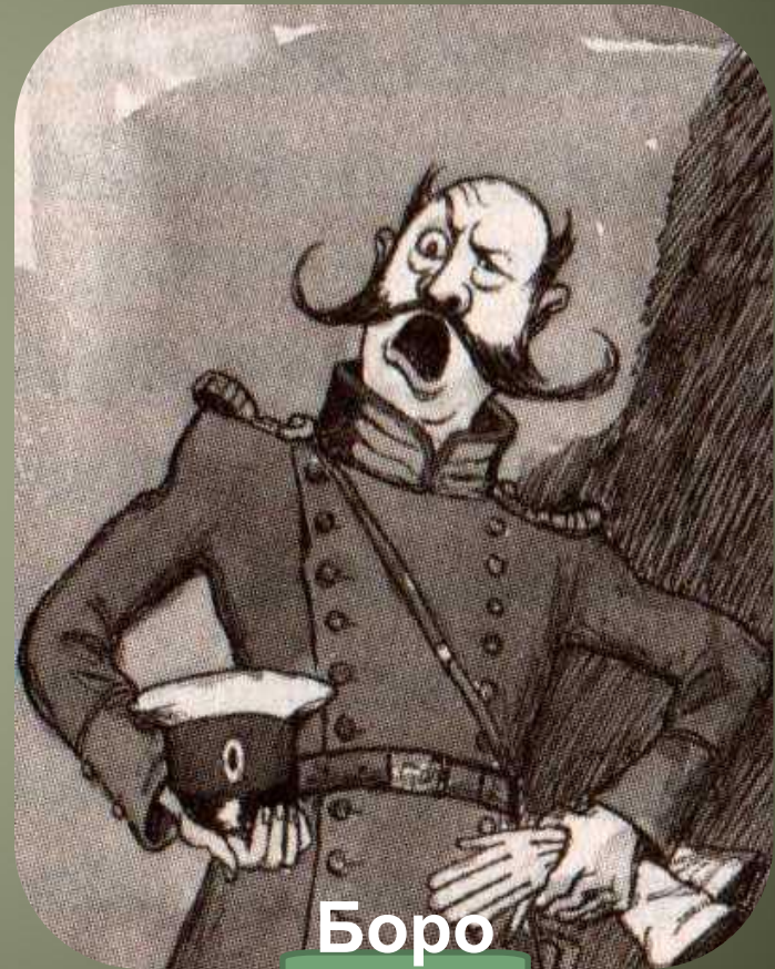
Боро давк ин