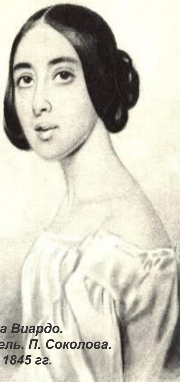
Полина Виардо. Акварель. П. Соколова. 1843 – 1845 гг.