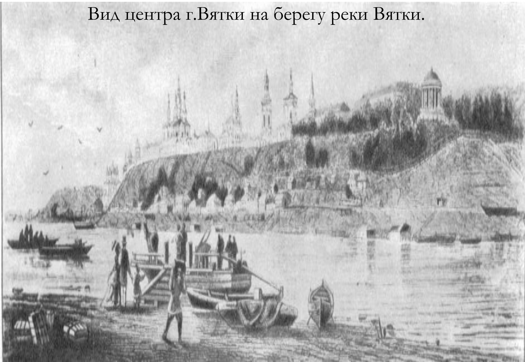
Вид центра г.Вятки на берегу реки Вятки.