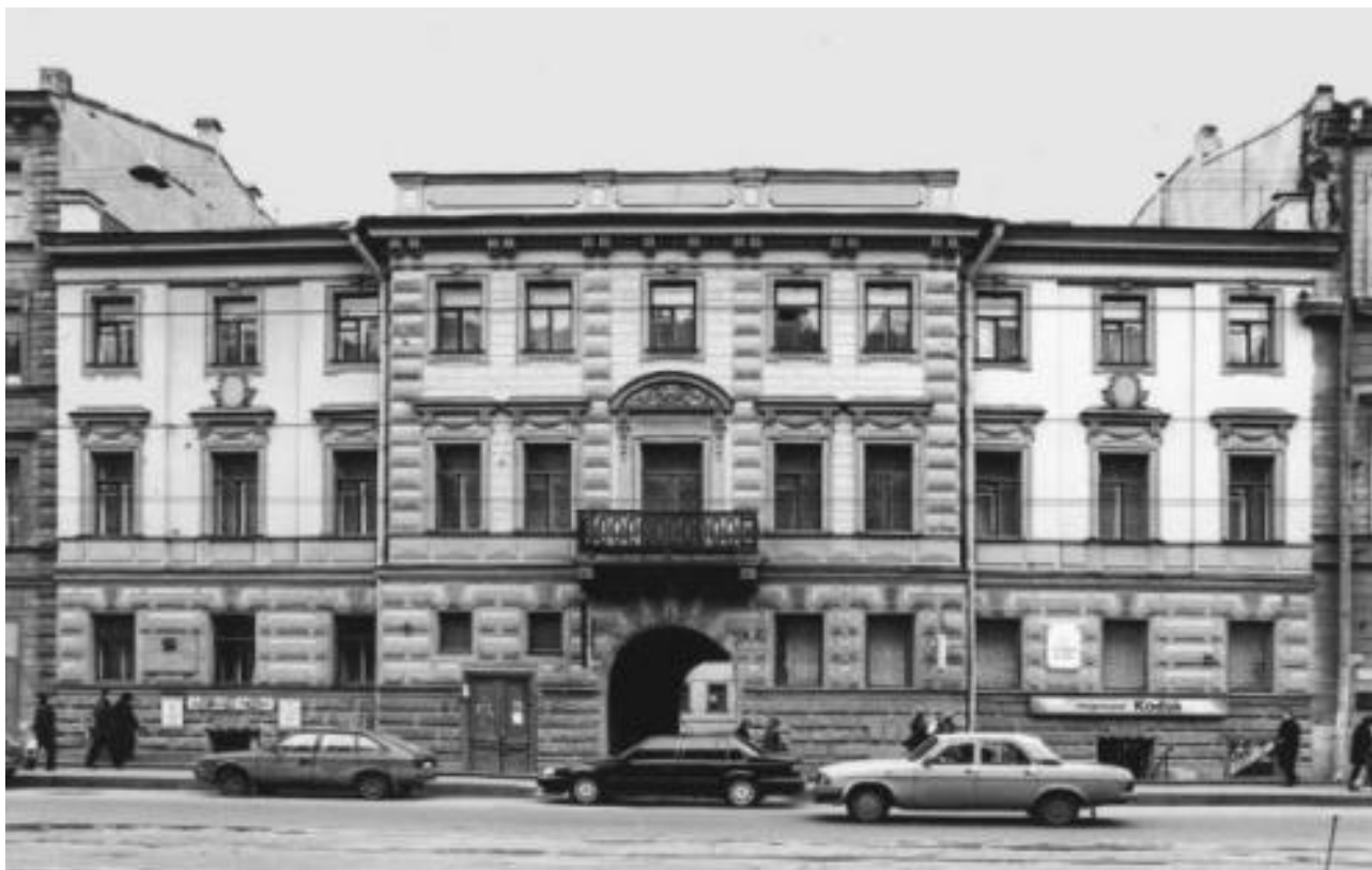
Дом, в котором жил и умер писатель М. Е. Салтыков-Щедрин в Петербурге

В феврале 1862 года Салтыков-Щедрин в первый раз вышел в отставку. Он хотел поселиться в Москве и основать там двухнедельный журнал; когда ему это не удалось, он переехал в Петербург и с начала 1863 года стал, фактически, одним из редакторов "Современника".