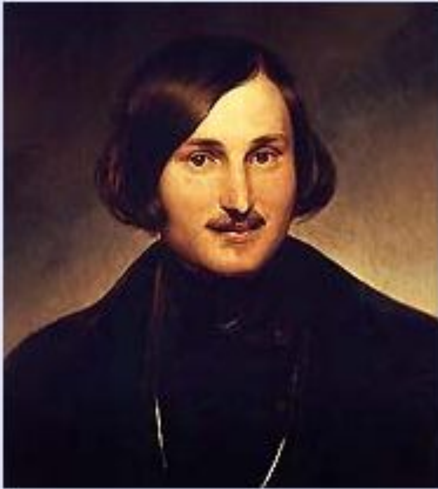
Н. В. Гоголь. Портрет работы Ф. А. Моллера. 1841 г.

Картины народной жизни, добро и зло в повести Н. В. Гоголя «Ночь перед Рождеством»