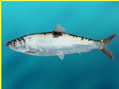
Рыба- сельдь 6