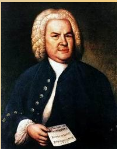
И. С. Бах