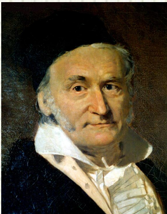
К. Ф. Гаусс