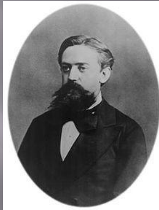
Андрей Андреевич Марков - русский математик, академик, внёсший большой вклад в теорию вероятностей, математический анализ и теорию чисел.