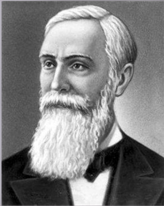
ЧЕБЫШЕВ (произносится Чебышёв) Пафнутий Львович (1821-94), математик, академик Петербургской АН