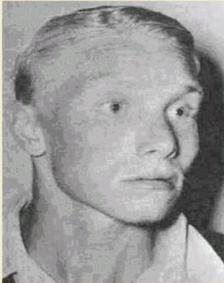
Рис. 12.8 Больной с фенилкетонурией. Слабая пигментация кожи, волос, радужной оболочки глаз, умеренная степень олигофрении