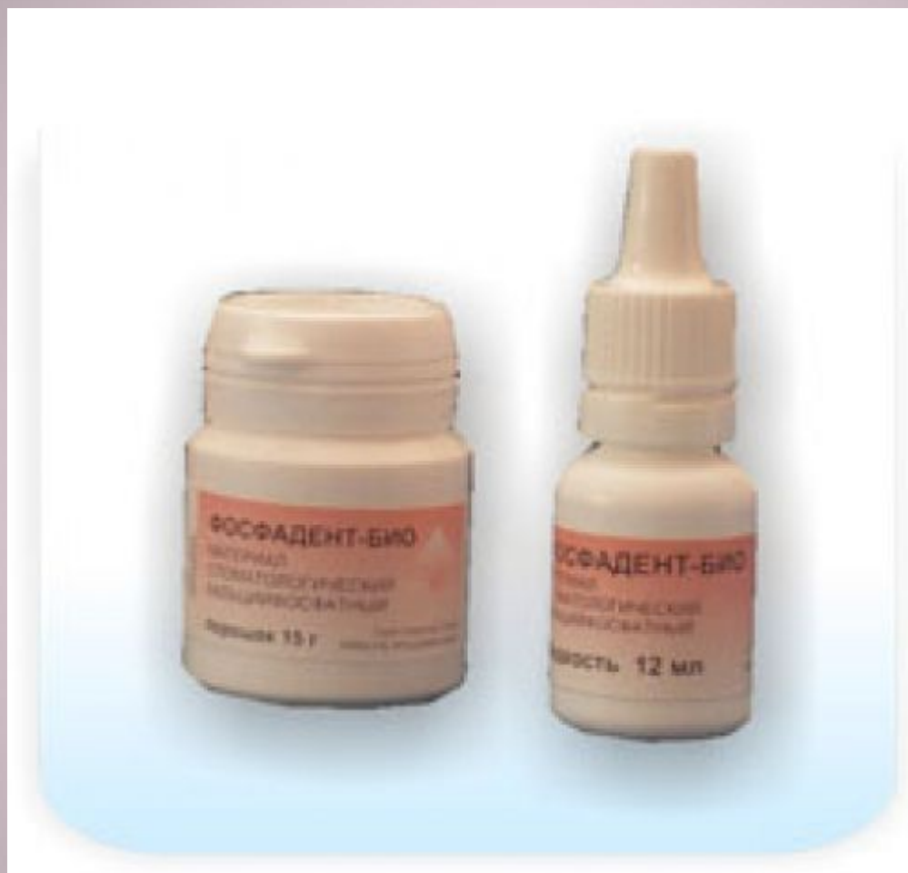
Фосфадент Био - цемент стоматологический