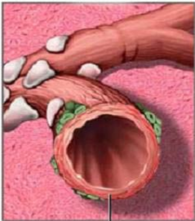
Нормальная бронхиальная труба