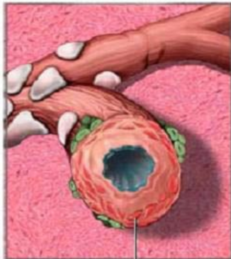
Воспаленная бронхиальная труба