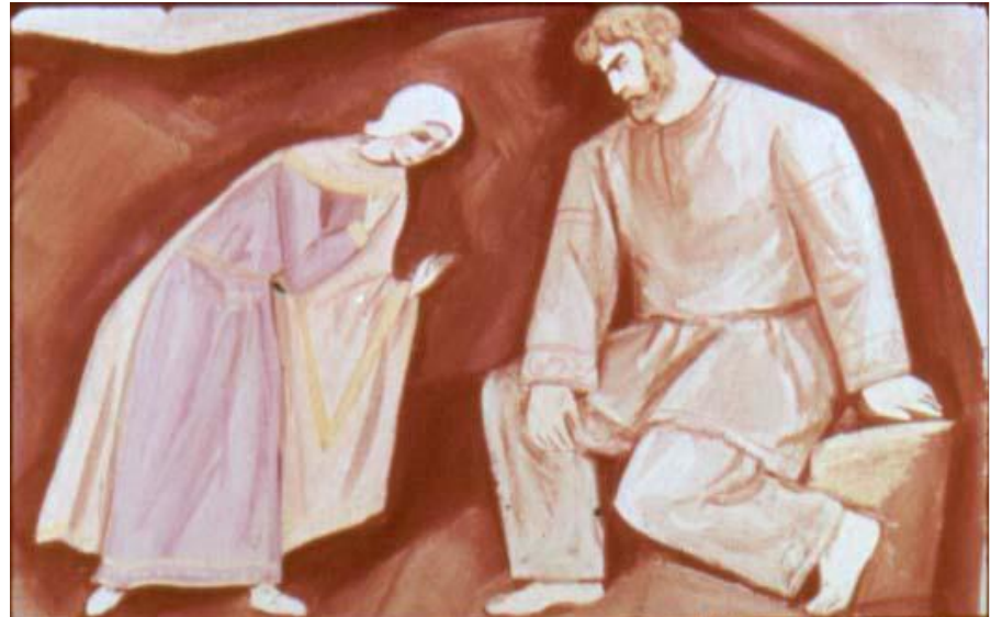
Подошла тут княжеская дочь, поклонилась Илье Ивановичу: „Не для князя, не для княгини, а для бедных вдов, для малых детей—ты постой за русских людей, за родную Русь!“

Все за столом призамолкнули: Меньший хоронится за большего. Большой хоронится за меньшаго, А от меньшаго мал ответ живет.