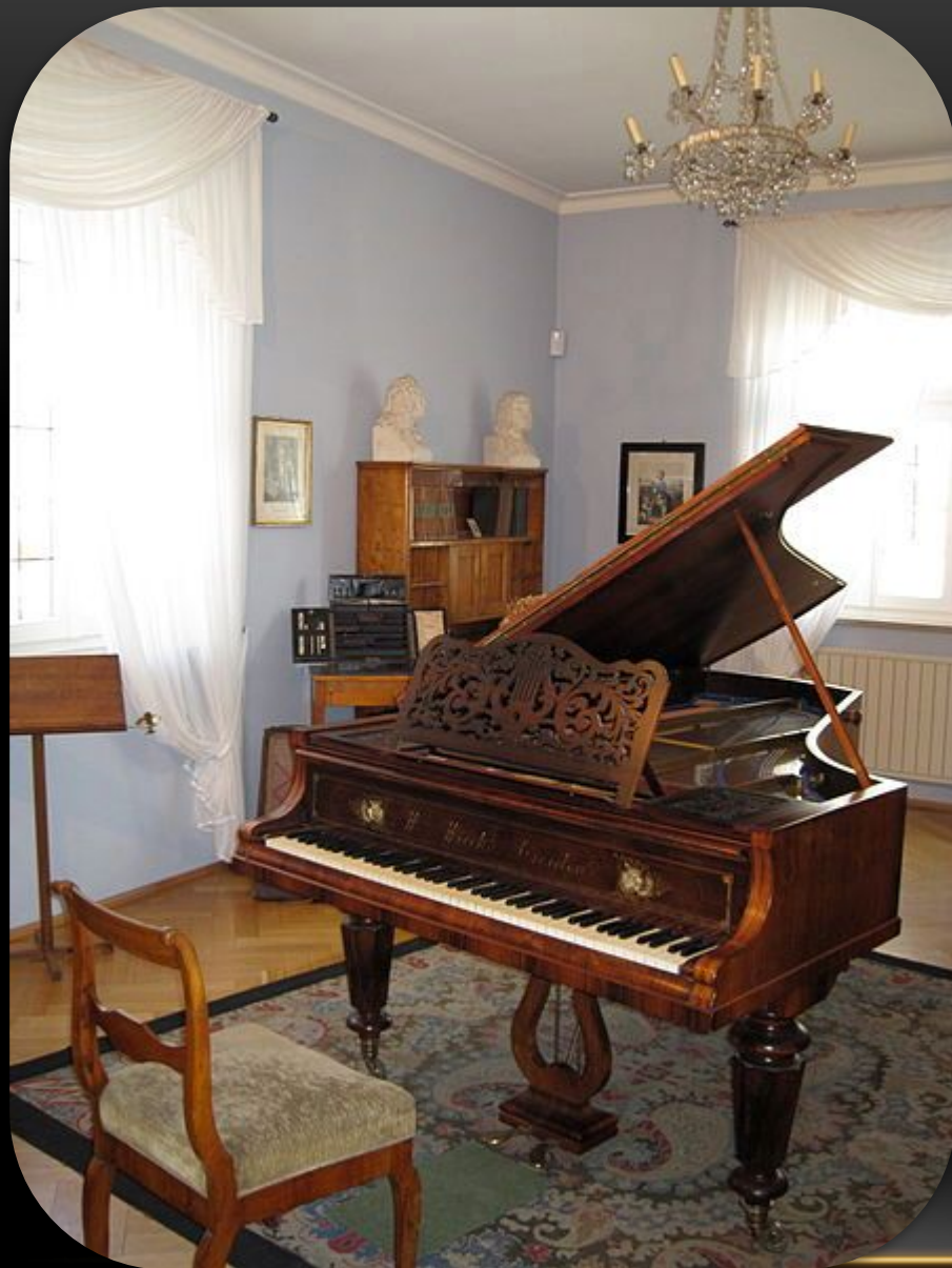
Музыкальная комната композитора в музее Шумана в Цвиккау

В 1828 году он поступил в Лейпцигский университет, а в следующем году перешёл в университет Гейдельберга. Он по настоянию матери планировал стать юристом, но музыка всё больше затягивала юношу. Его влекла идея стать концертирующим пианистом. В 1830 году он получил разрешение матери полностью посвятить себя музыке и вернулся в Лейпциг, где надеялся найти подходящего наставника. Там он начал брать уроки фортепиано у Ф. Вика и композиции у Г. Дорна. Стремясь стать настоящим виртуозом, он занимался с фанатичным упорством, но именно это и привело к беде: форсируя упражнения с механическим устройством для укрепления мышц руки, он повредил правую руку. Средний палец перестал действовать и, несмотря на длительное лечение, рука навсегда сделалась неспособной к виртуозной игре на фортепиано. Мысль о карьере профессионального пианиста пришлось оставить. Тогда Шуман серьёзно занялся композицией и одновременно музыкальной критикой. Найдя поддержку в лице Фридриха Вика, Людвига Шунке и Юлиуса Кнорра, Шуман смог в 1834 году основать одно из влиятельнейших в дальнейшем музыкальных периодических изданий — «Новую музыкальную газету» (нем. Neue Zeitschrift für Musik ), которое на протяжении нескольких лет редактировал и регулярно публиковал в нём свои статьи. Он зарекомендовал себя приверженцем нового и борцом с отжившим в искусстве, с так называемыми филистерами, то есть с теми, кто своей ограниченностью и отсталостью тормозил