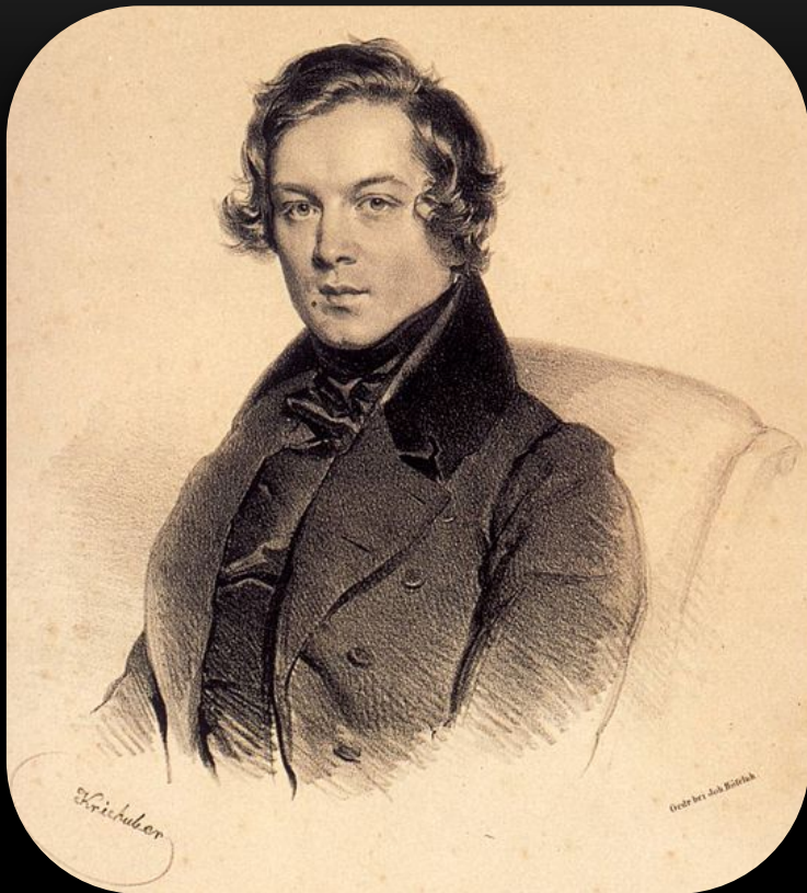
Роберт Шуман, Вена, 1839

Интеллектуал и эстет, в своей музыке Шуман больше, чем любой другой композитор, отразил глубоко личностную природу романтизма. Его ранняя музыка, интроспективная и зачастую причудливая, была попыткой порвать с традицией классических форм и структур, по его мнению, слишком ограниченных. Во многом родственное поэзии Г. Гейне, творчество Шумана бросало вызов духовной убогости Германии 1820-х — 1840-х годов, звало в мир высокой человечности. Наследник Ф.