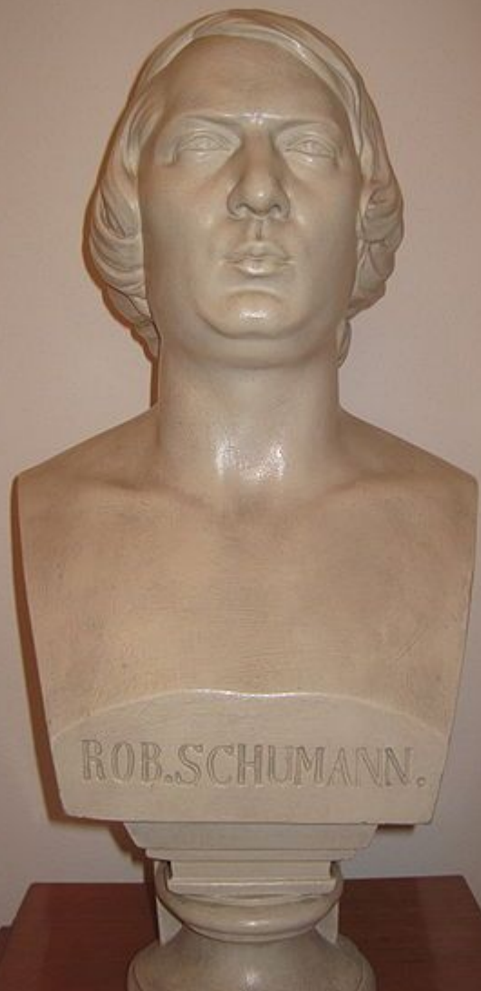
Бюст Роберта Шумана

http://ru.wikipedia.org/wiki/%D8%F3%EC%E0%ED,_%D0%EE%E1%E5%F0%F2