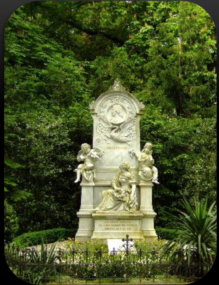
Могилы Роберта и Клары Шуман