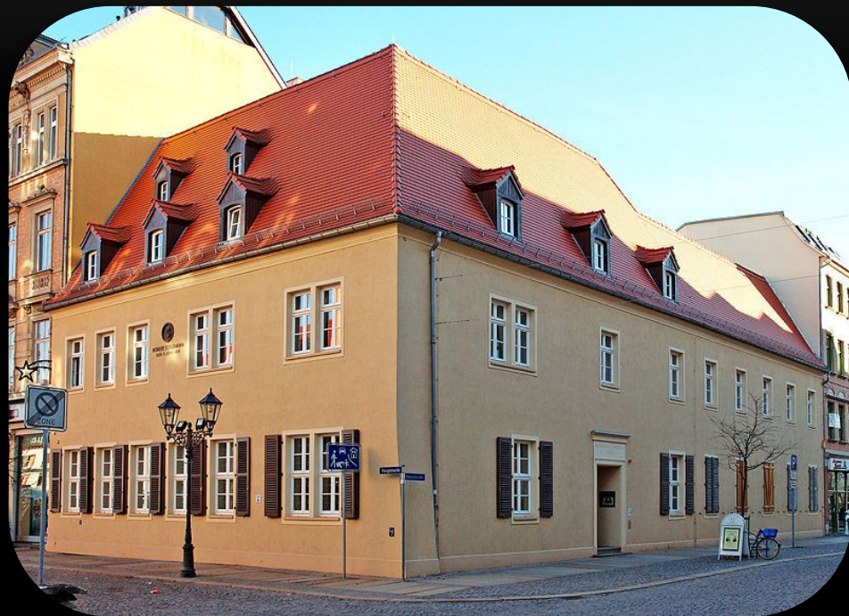
Дом Шумана в Цвикау