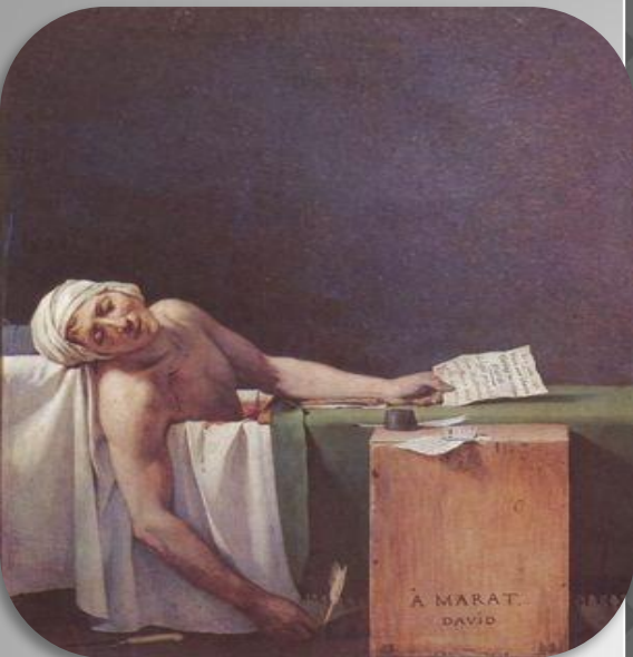
Давид «Смерть Марата»