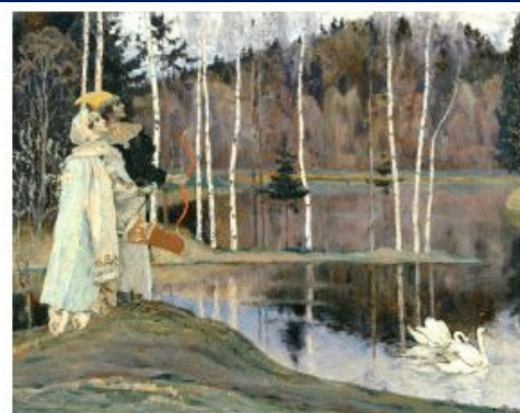
Н.Нестеров. «Два лада».