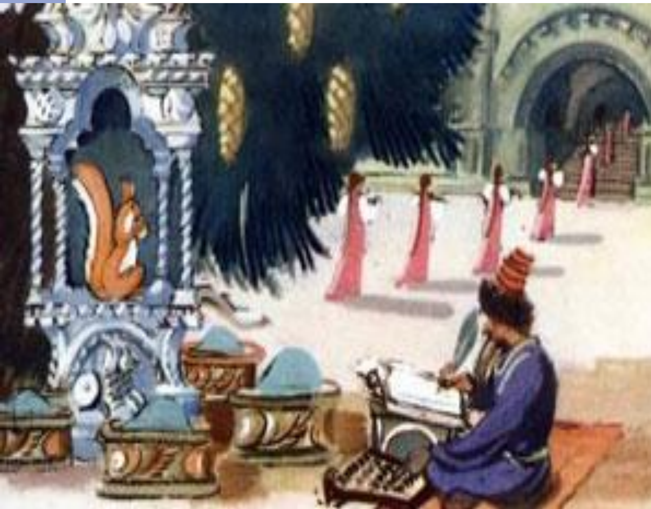
Иллюстрация к сказке А.С. Пушкина «Сказка о царе Салтане»

Ель растёт перед дворцом, А под ней хрустальный дом; Белка там живёт ручная, Да затейница какая! Белка песенки поёт Да орешки всё грызёт, А орешки не простые, Всё скорлупки золотые, Ядра — чистый изумруд