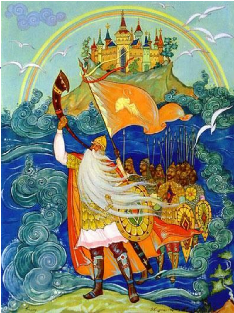
Иллюстрация к сказке А.С. Пушкина «Сказка о царе Салтане»

В свете есть иное диво: Море вздуется бурливо, Закипит, подымет вой, Хлынет на берег пустой, Разольётся в шумном беге, И очутятся на бреге, В чешуе, как жар горя, Тридцать три богатыря, Все красавцы удалые, Великаны молодые, Все равны, как на подбор, С ними дядька Черномор.