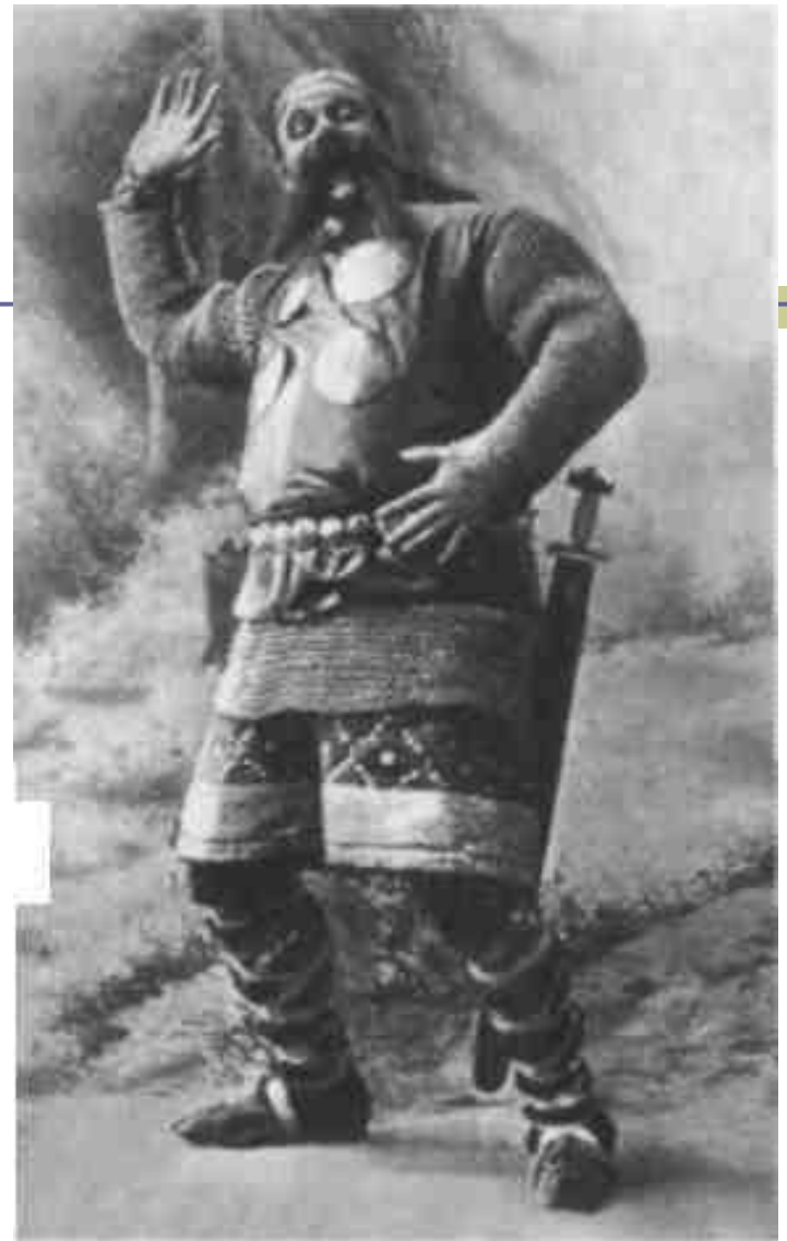
Ф. Шаляпин в роли Фарлафа