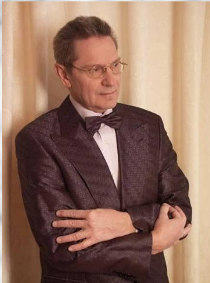
Музыка Давида Тухманова