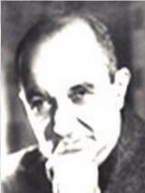
Слова В. Агатова