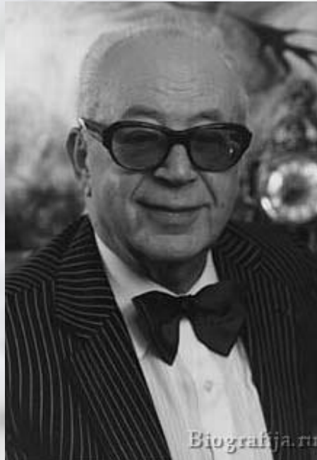
Музыка Н. Богословского