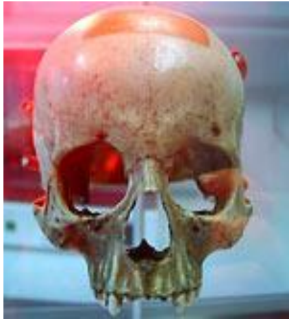
Череп Моцарта в Зальцбургском музее