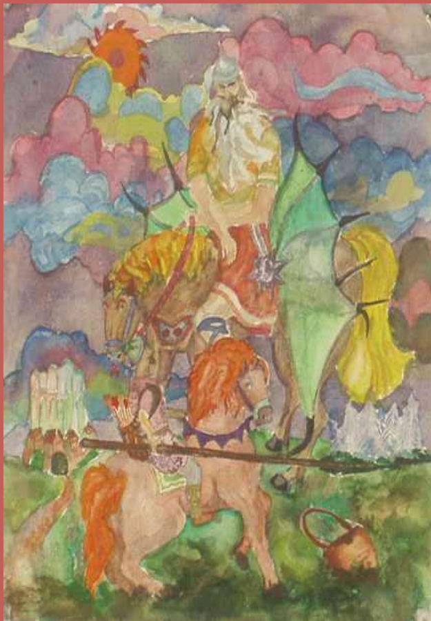
Илья Муромец и Святогор

Как припев в песне, повторяются и в былине стихи. Так в былине «Илья Муромец и Калин-царь» читаем: