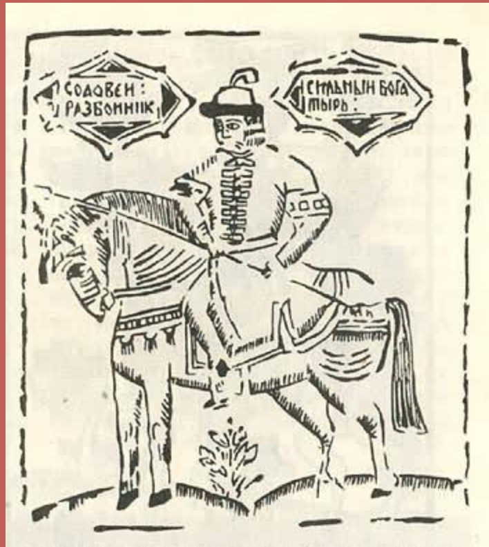
Соловей-разбойник. Лубочная картинка. Север. Конец XVII века.

То пехотою никто да не прохаживал, И на добром коне никто да не проезживал, Туда серый зверь да не прорыскивал, Птица чёрный ворон не пролётывал. («Илья Муромец и Соловей- Разбойник»)