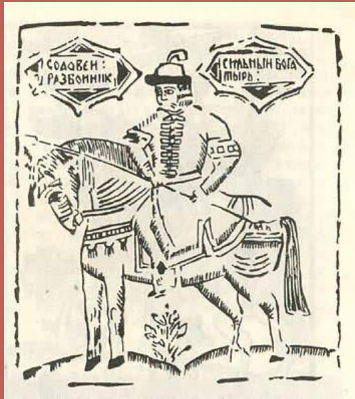
Соловей-разбойник. Лубочная картинка. Север. Конец XVII века.

То пехотою никто да не прохаживал, И на добром коне никто да не проезживал, Туда серый зверь да не прорыскивал, Птица чёрный ворон не пролётывал. («Илья Муромец и Соловей- Разбойник»)