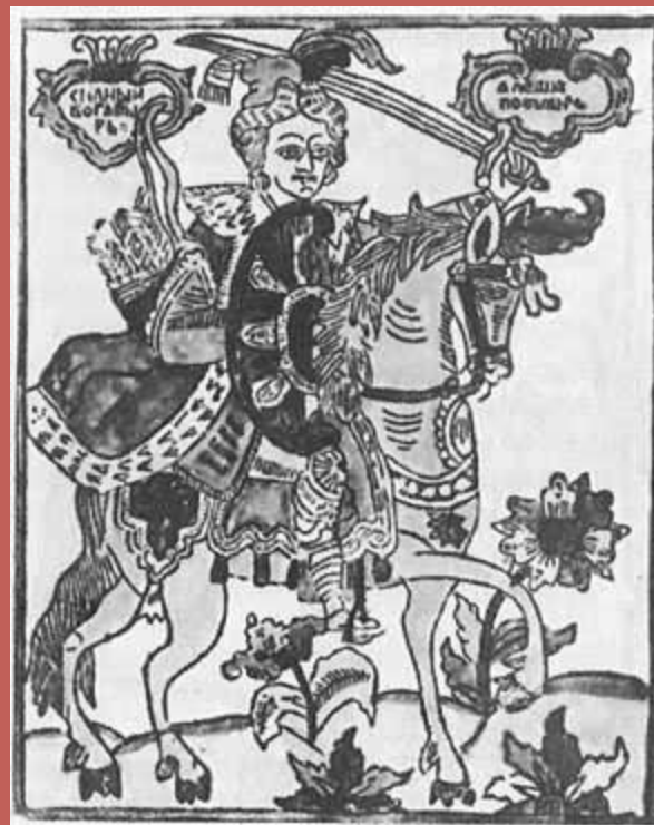
Богатырь Алеша Попович. Лубочная картинка. Север. Конец XVII века

А тут той старинке и славу поют, А по твоих мест старинка и покончилась.