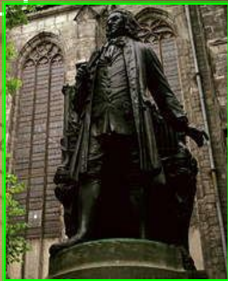
Памятник И.С.Баху в Лейпциге