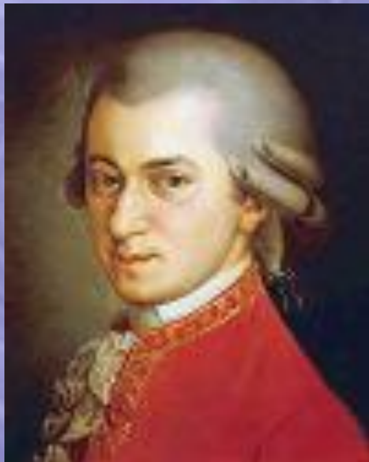
Вольфганг Амадей Моцарт (1756–1791)