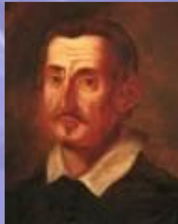
Джироламо Фрескобальди (1583–1643)