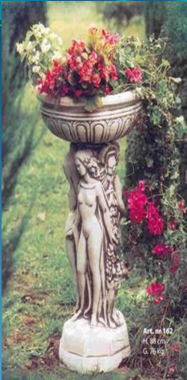
Art. nr 162 H. 88 cm G. 76 kg