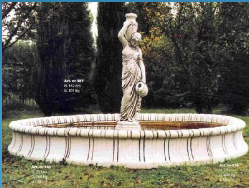
Art. nr 381 H. 142 cm G. 101 kg