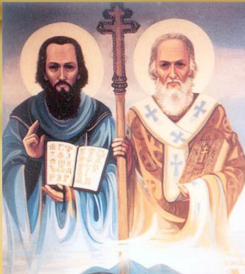
Святые равноапостольные Кирилл и Мефодий