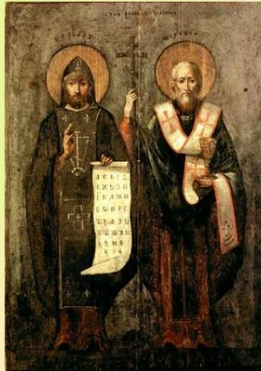
Кирилл и Мефодий – создатели славянской азбуки