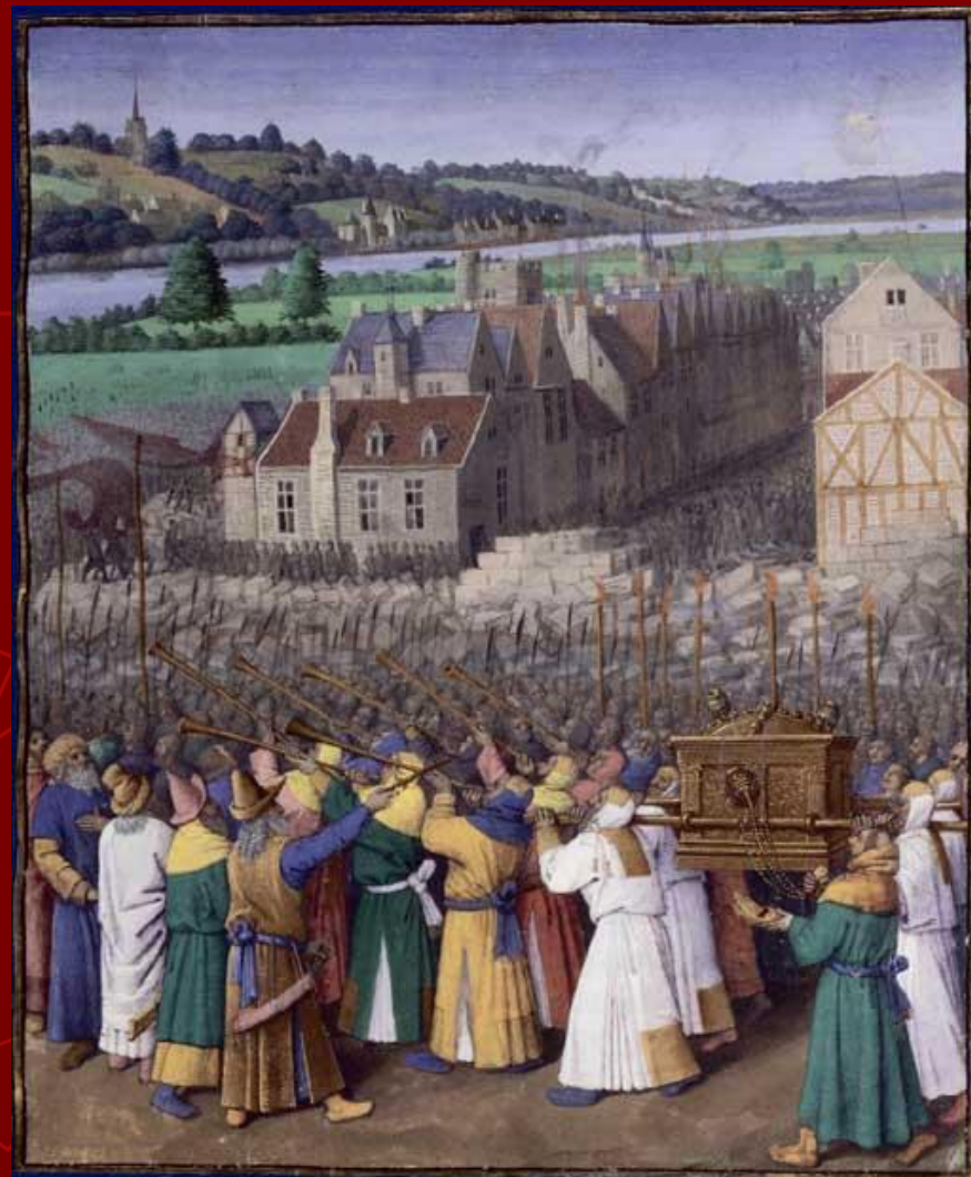
Жан Фуке. «Взятие Иерихона»

Великолепны его миниатюры к рукописи «Больших французских хроник» , заказанных Карлом VII (другая рукопись «Больших французских хроник» проиллюстрирована Симоном Мармионом по заказу герцога Бургундии Филиппа III Доброго). Миниатюры «Хроник» Фуке прославляют французский королевский дом, жизнь которого протекла в пирах и торжественных церемониях ( «Карл Великий Находит тело Роланда» , «Пир в честь Карла IV» , «Коронование Карла Великого» , «Жизнь Людовика II Заики» и др.)