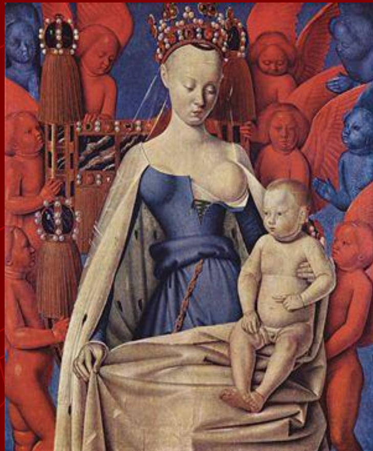
Жан Фуке . Дева Мария

К значительным произведениям Художника можно отнести «Меленский диптих» (ок. 1451-1456), заказанный Фуке Этьеном Шевалье для церкви в его родном городе Мелене.