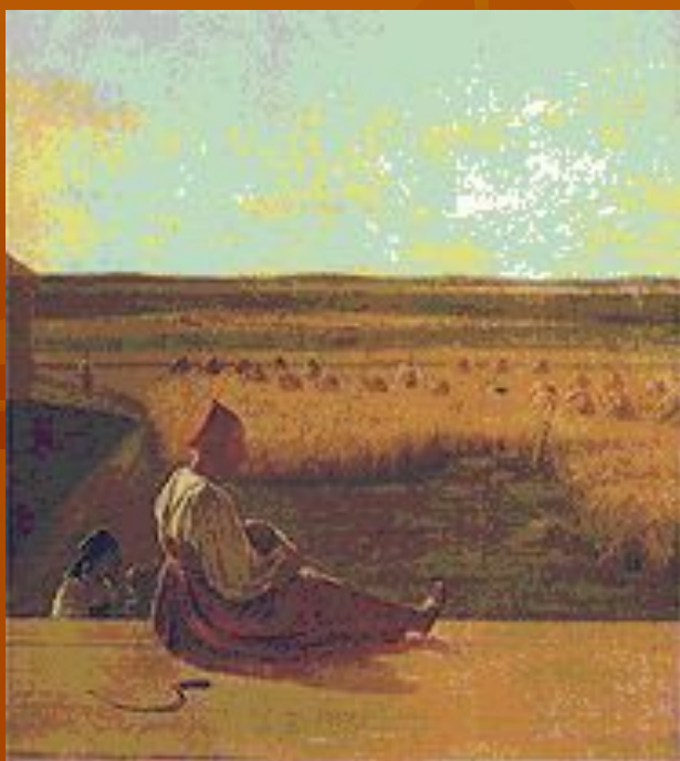
А. Г. Венецианов. «На жатве. Лето». Середина 1820-х гг.