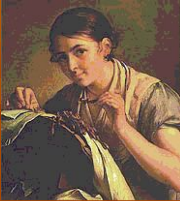
В. А. Тропинин. «Кружевница». 1823 год. Третьяковская галерея.