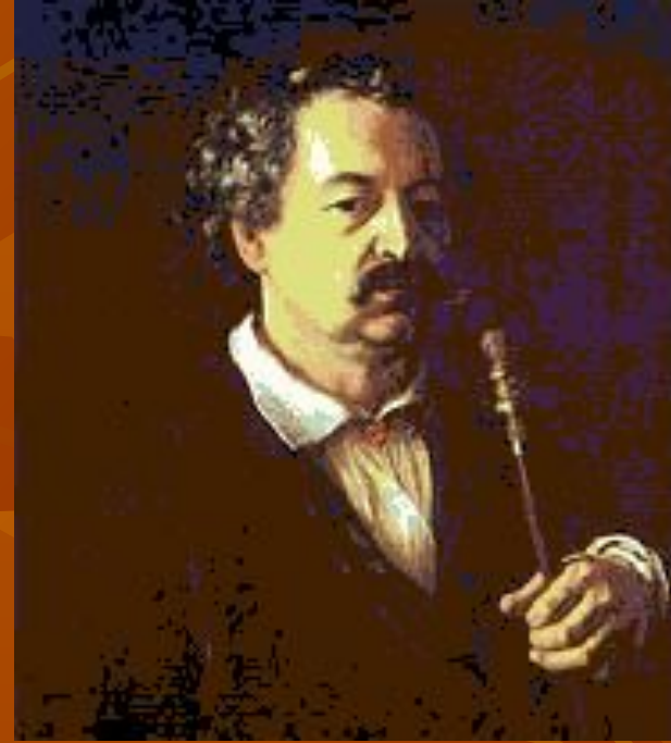
В. А. Тропинин. «Портрет неизвестного в халате с трубкой».