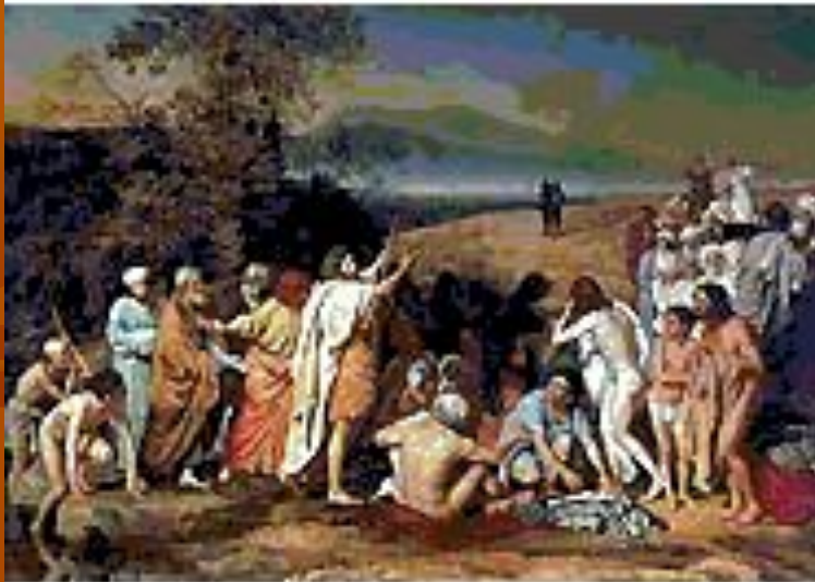
А. А. Иванов. «Явление Христа народу» (1837-57, Третьяковская галерея).