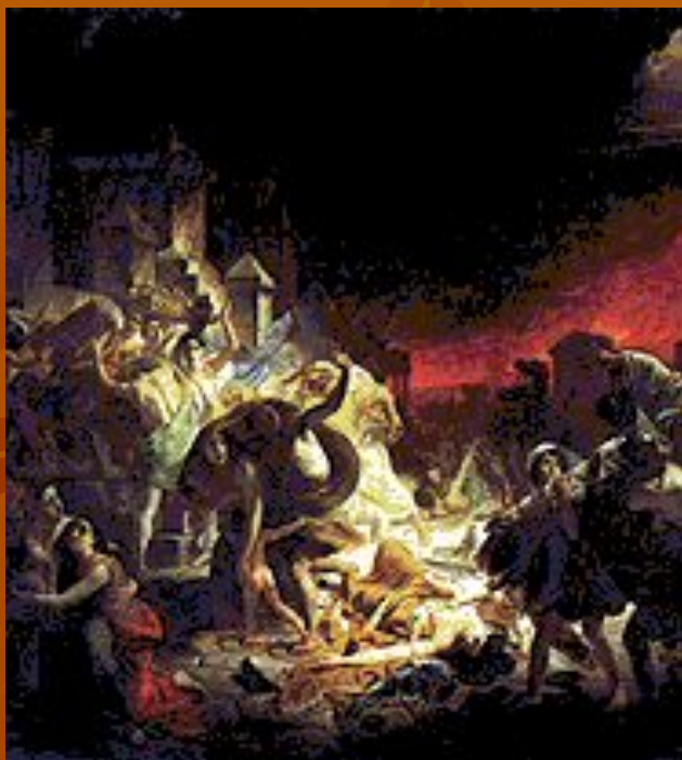
К. П. Брюллов. «Последний день Помпеи».