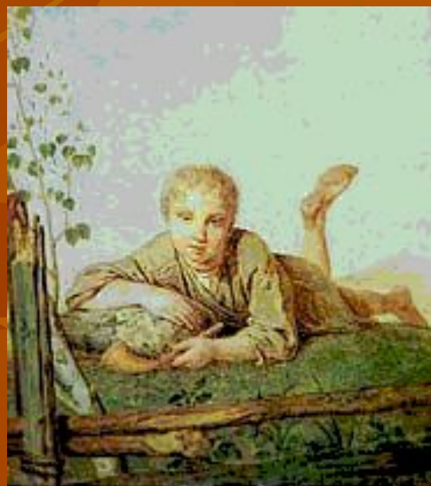
А. Г. Венецианов. «Пастушок с дудкой». 1820-е годы.