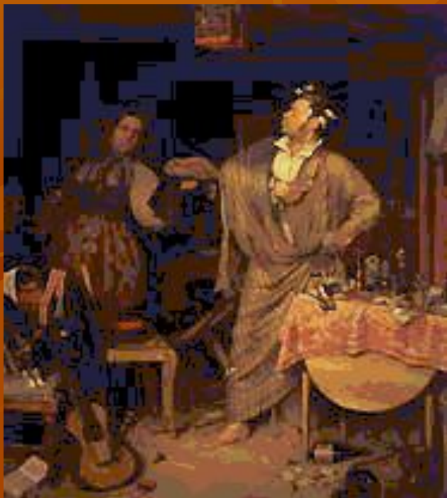
П. А. Федотов. «Свежий кавалер». 1846. Третьяковская галерея.