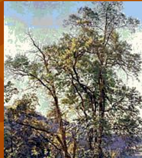
Александр Иванов. Олива. Третьяковская галерея в Москве.