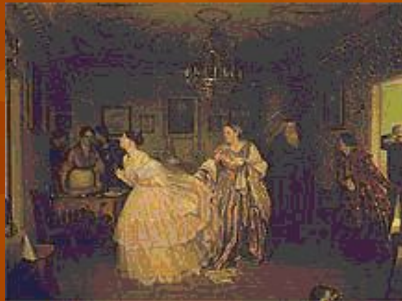
П. А. Федотов. «Сватовство майора». 1848 год. Третьяковская галерея.