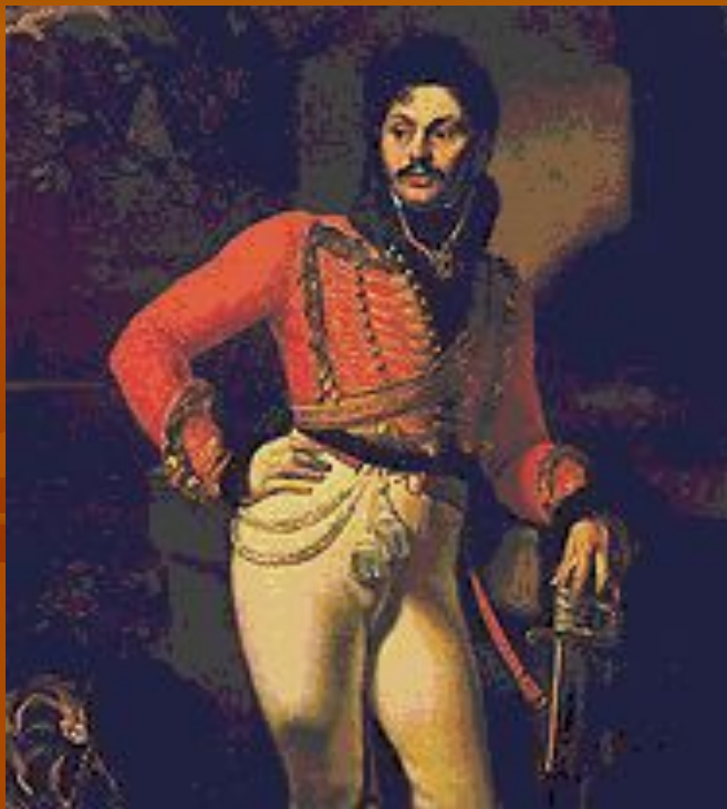
О. А. Кипренский. «Портрет лейб-гусарского полковника Евграфа Давыдова». 1809.