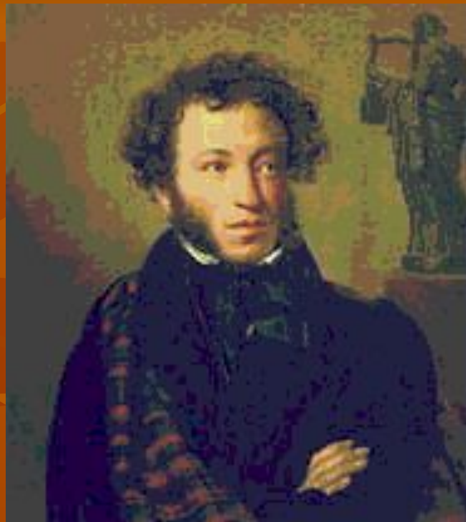
А. С. Пушкин. Портрет работы О. А. Кипренского (1827, Третьяковская галерея).