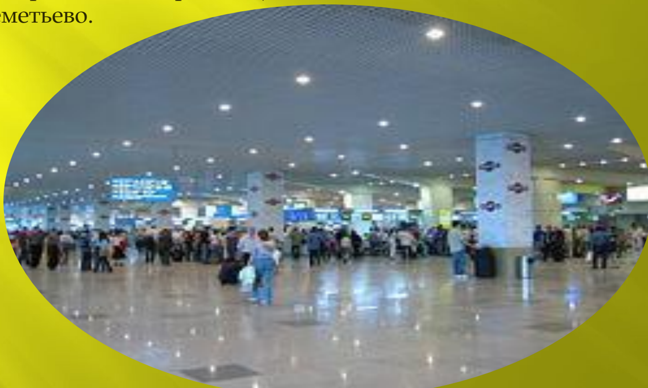
Терминал аэропорта Домодедово.

На территории Москвы находится международный аэропорт Внуково. Также жители и гости города пользуются услугами других международных аэропортов, расположенных на территории соседнего субъекта Российской Федерации – Московской области: Домодедово, Остафьево, Чкаловский (действующий военный аэродром, осуществляет чартерные пассажирские авиаперевозки), Шереметьево.