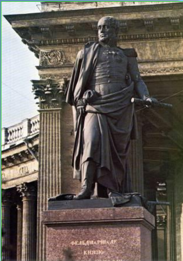
Памятник М.Б.Барклаю-Де-Толли. Скульптор Б.И. Орловский, Архитектор В.П. Стасов. 1829-1837

Главными событиями русской истории начала 19 века явились Отечественная война 1812 года и восстание декабристов в 1825 г., оказавшие огромное влияние на весь ход художественного развития России и определившие круг вопросов и тем и вопросов, волновавших русских романтиков.