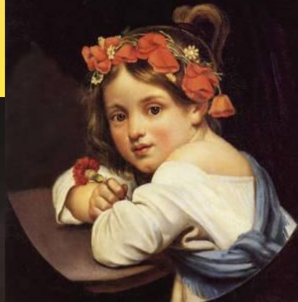
Девочка в маковом венке с гвоздикой в руке. 1819 г