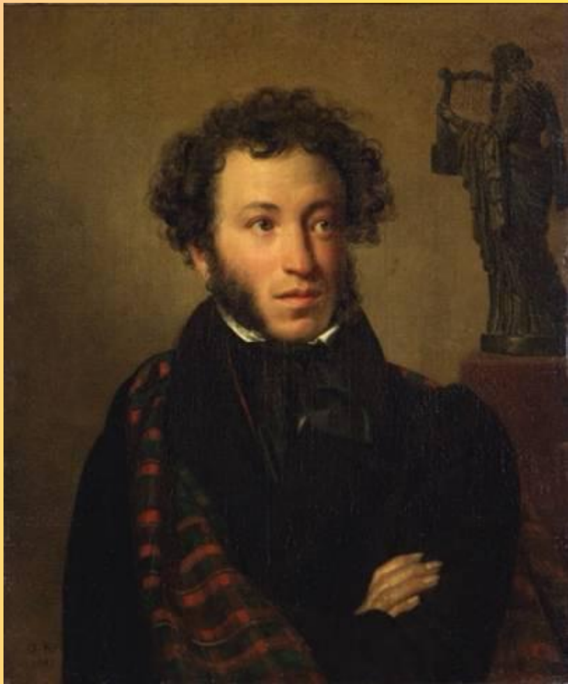
Портрет А.С. Пушкина. 1827 год