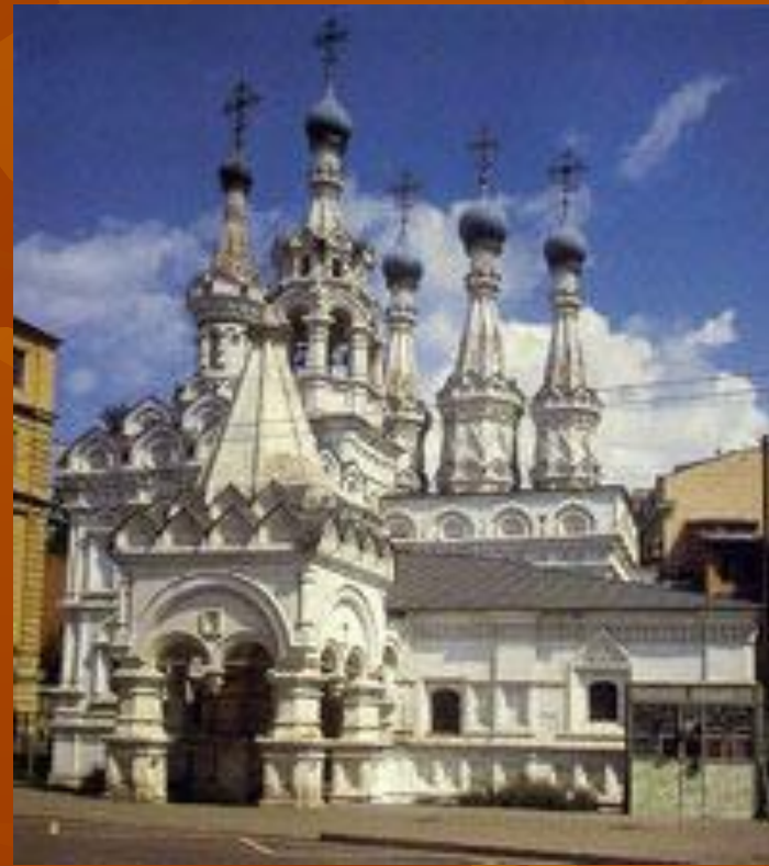
Церковь Рождества Богородицы в Путинках

XVII в. принес с собой новые художественные веяния. Архитектура становилась все более нарядной, церкви напоминали порой сказочные терема, стены зданий украшали изразцами и расписывали яркими красками. Не осталось без изменений и шатровое зодчество. Часто из основного перекрытия шатер превращался в декоративную деталь завершения и потому терял связь с внутренним пространством сооружения. Иногда он венчал уже не весь объем, а только его часть или даже заменял собой церковные главки. В 1649–1652 гг. в Москве была построена церковь Рождества Богородицы в Путинках. В ее богатом убранстве были использованы сразу четыре декоративных шатра, поставленных на узкие изящные барабаны, которые в свою очередь покоились на сводах. Эта церковь уже не являлась в буквальном смысле шатровой, поскольку шатры были использованы архитекторами лишь для украшения постройки. Однако она знаменита тем, что стала последним памятником шатрового зодчества в Москве. В 1652 г. патриарх Никон предписал впредь церкви «строить о единой, о трех, о пяти главах, а шатровые церкви отнюдь не строить». По мнению ученых, этот запрет был обоснован несколькими причинами: во-первых, проведением церковной реформы и, соответственно, отказом от «всего старого», во-вторых, стремлением патриарха приблизиться к византийскому образцу. Впоследствии запрет был подтвержден, а в качестве примера зодчим указали пятиглавый Успенский собор Московского Кремля.