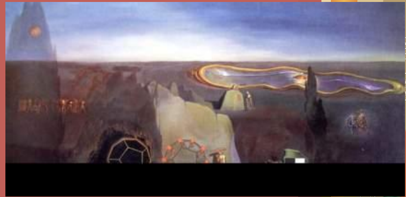
В поисках четвёртого измерения 1979г.