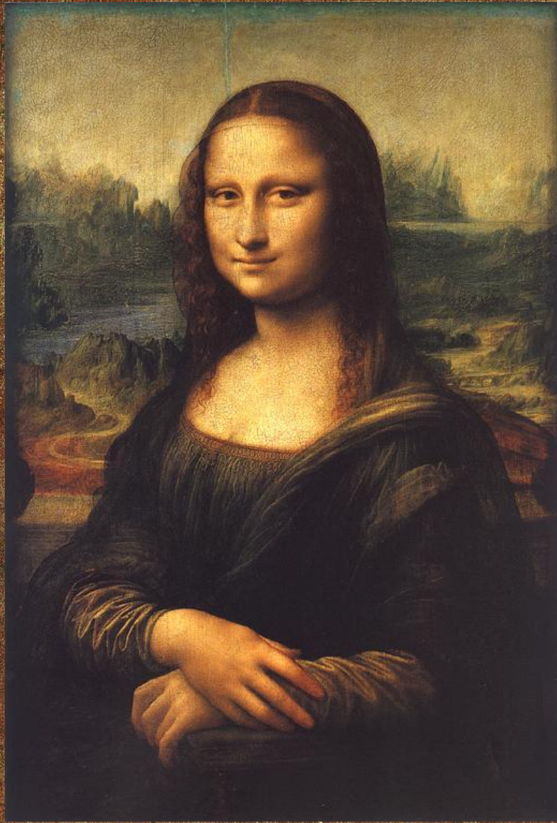
«Мона Лиза» (Джаконда) 1514 - 1515