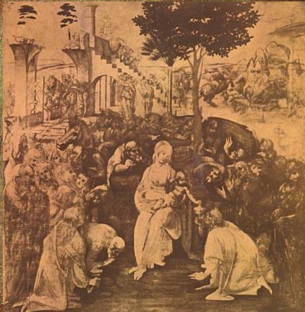
Поклонение волхвов (Флоренция, Уффици).