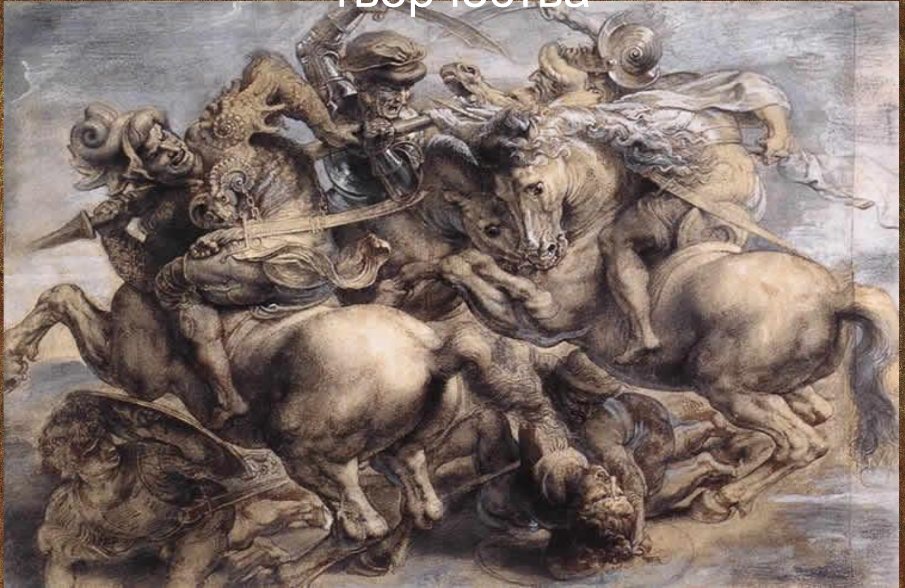
«Битва в Анджарии» - Стенная роспись в зале Большого совета дворца Синьории, Флоренция (1503-1505 )