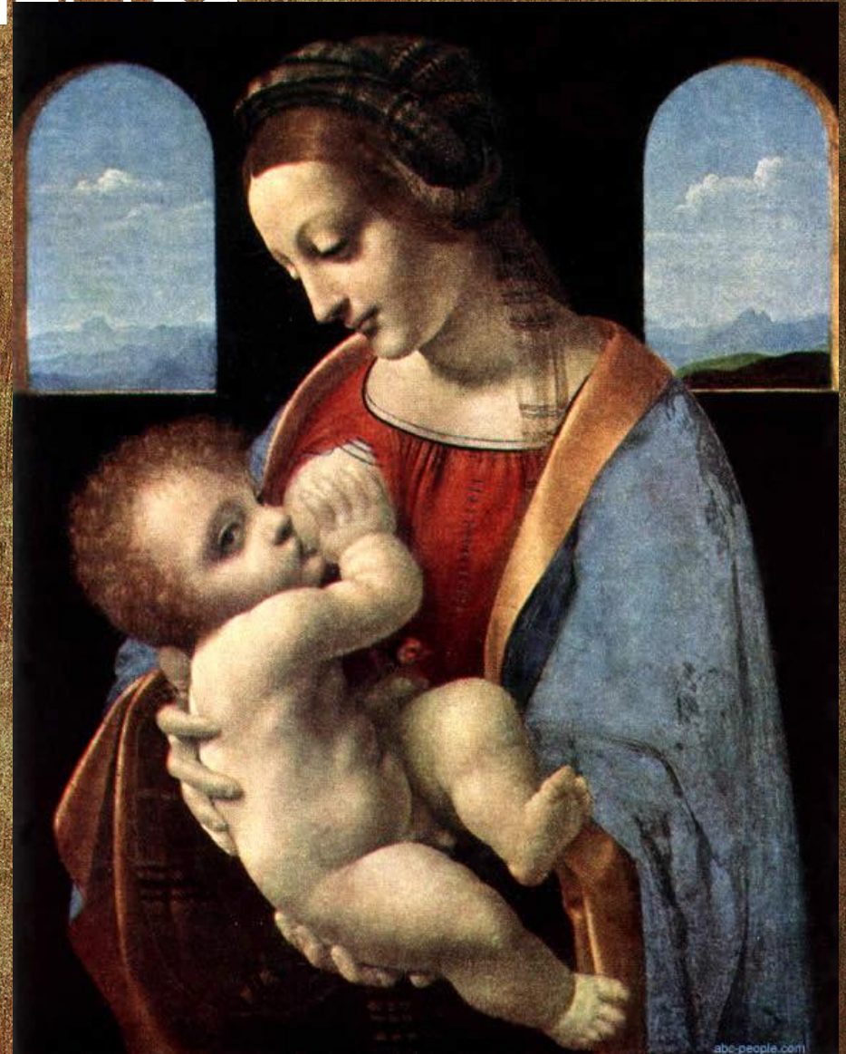
Мадонна Литта (1478-1482)