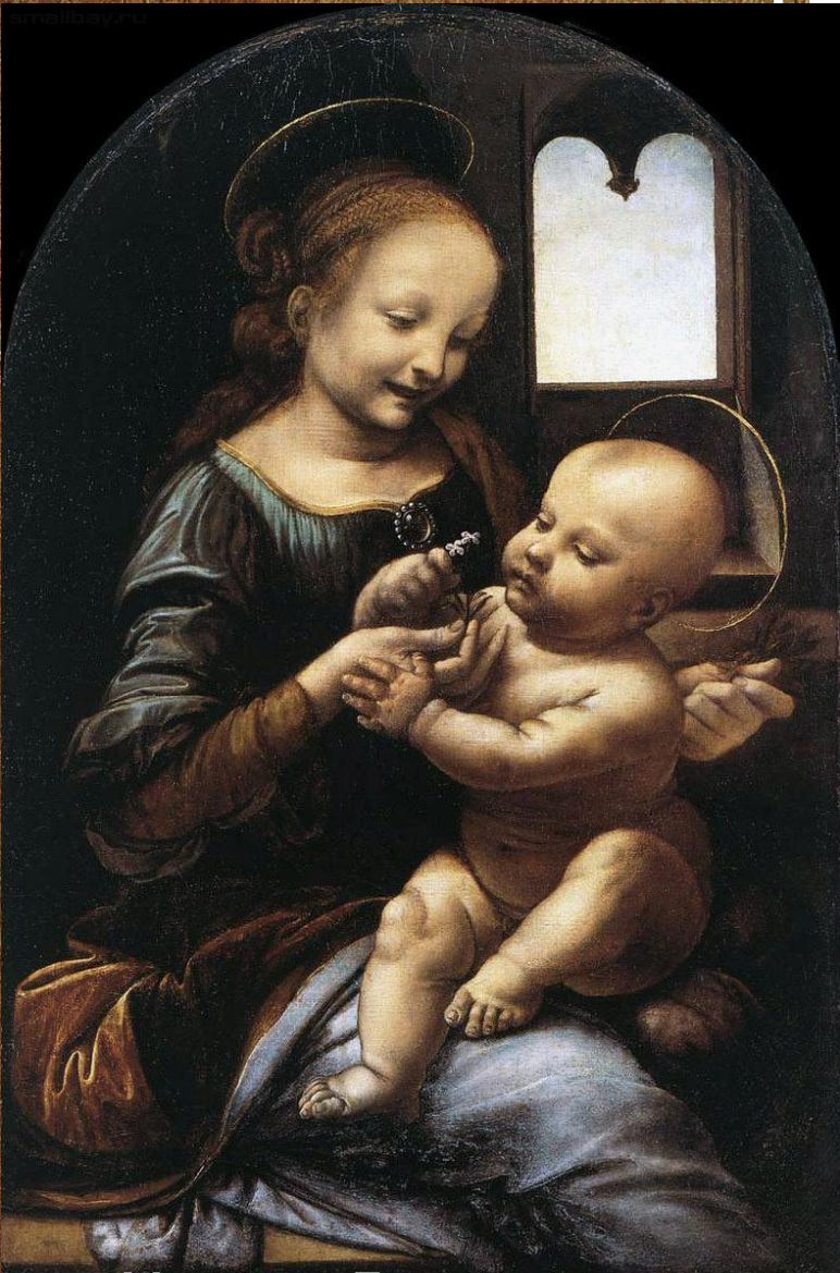
«Мадонна Бенуа», 1478 («Мадонна с