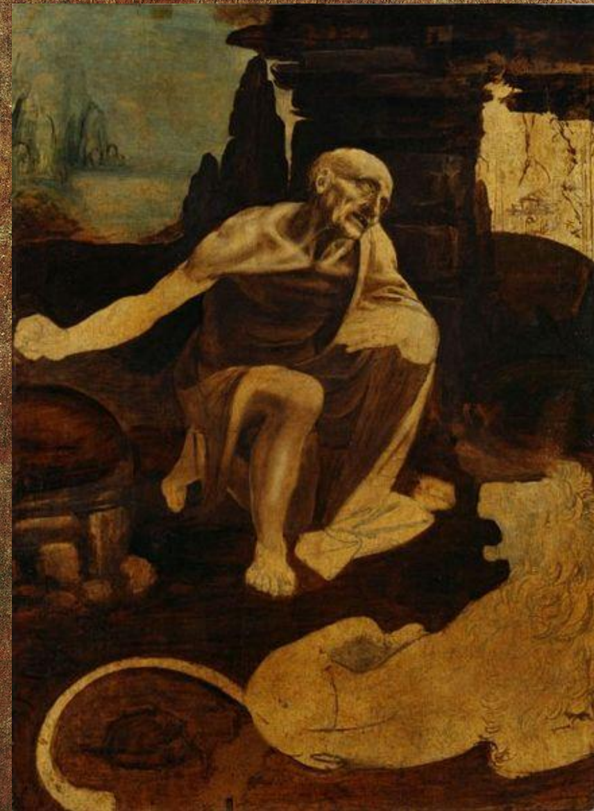
«Святой Иероним» (Рим, Ватиканская