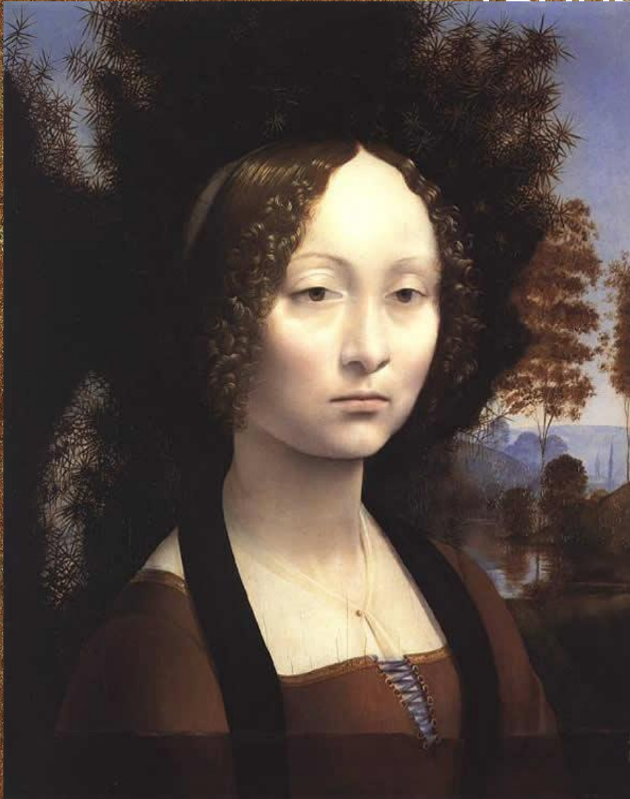
Картина «Портрет Жиневры де Бенчи»