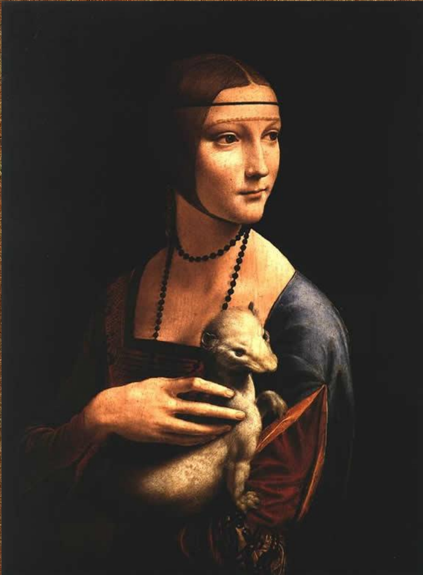
«Дама с горностаем» (1488-1490)