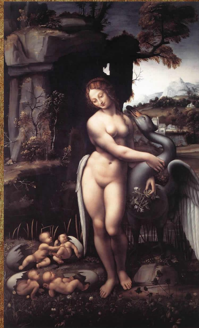
«Леда с лебедем» (1508 - 1515)