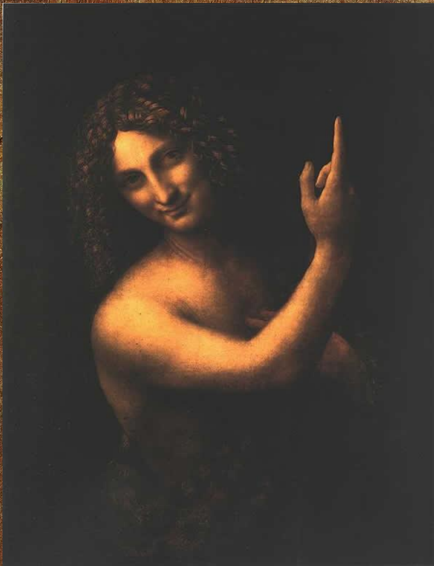
«Иоанн Креститель» 1512