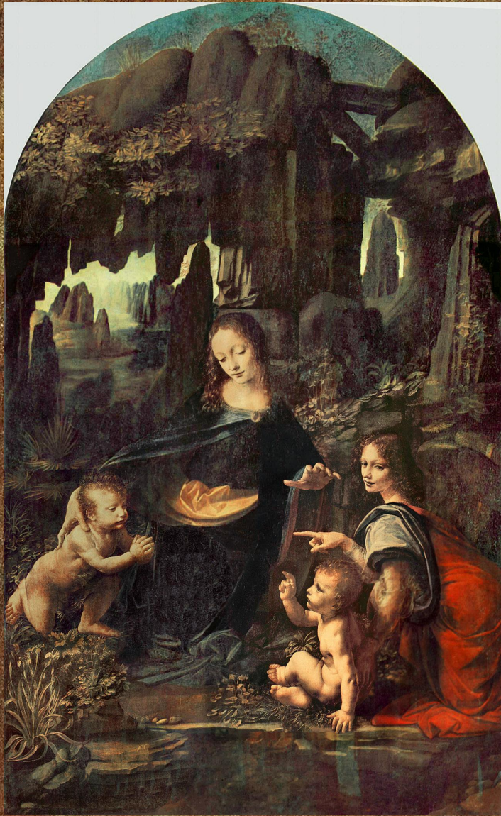
«Мадонна в гроте» (1483—1494, Париж, Лувр).