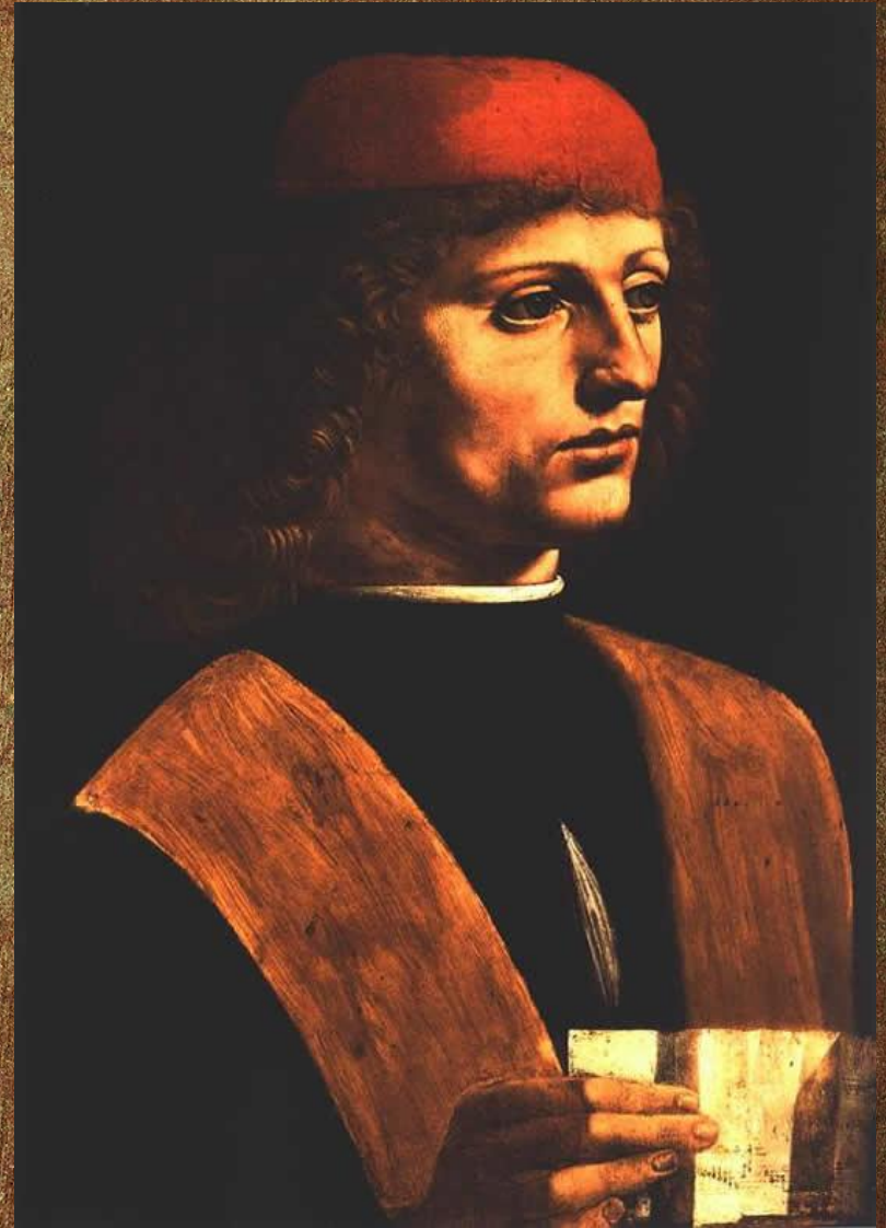
«Портрет музыканат» (1485-1490)