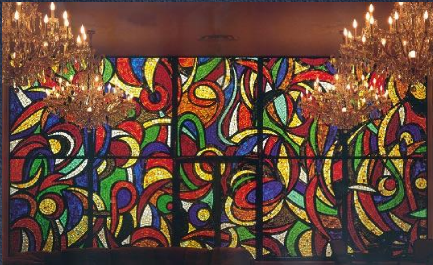
Зураб Церетели Витраж «Салют» в Постоянном Представительстве Российской Федерации в ООН. Нью-Йорк, США