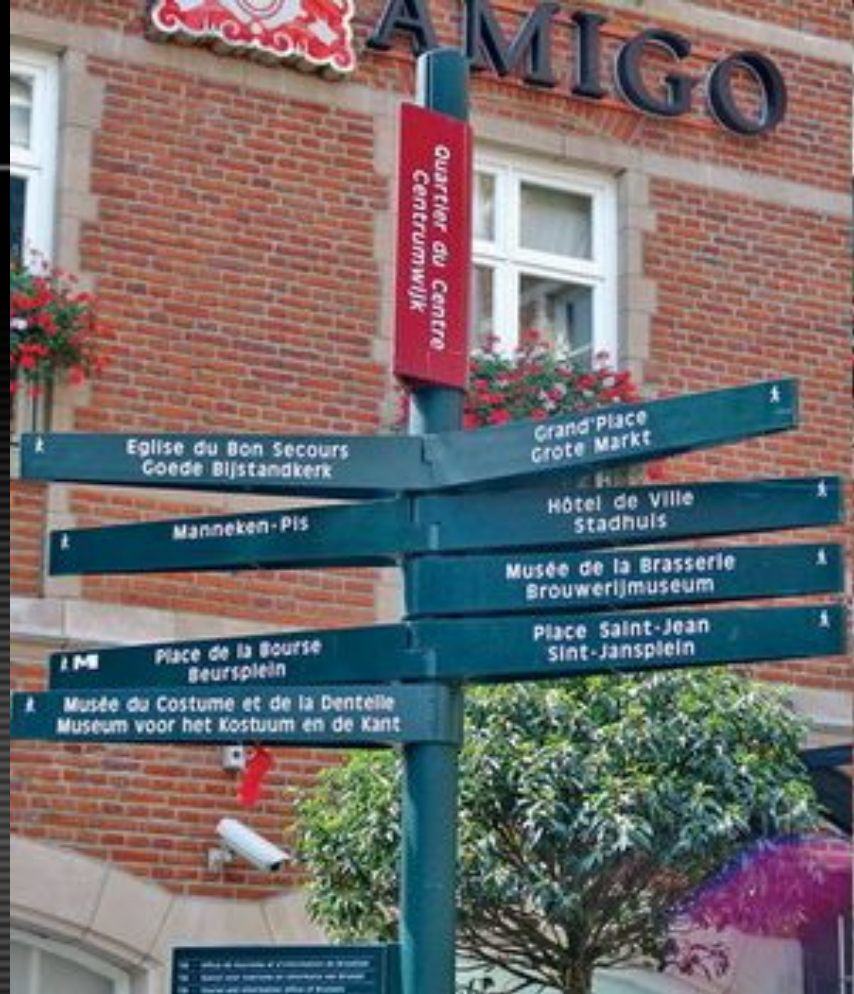
Двуязычные вывески в Бельгии