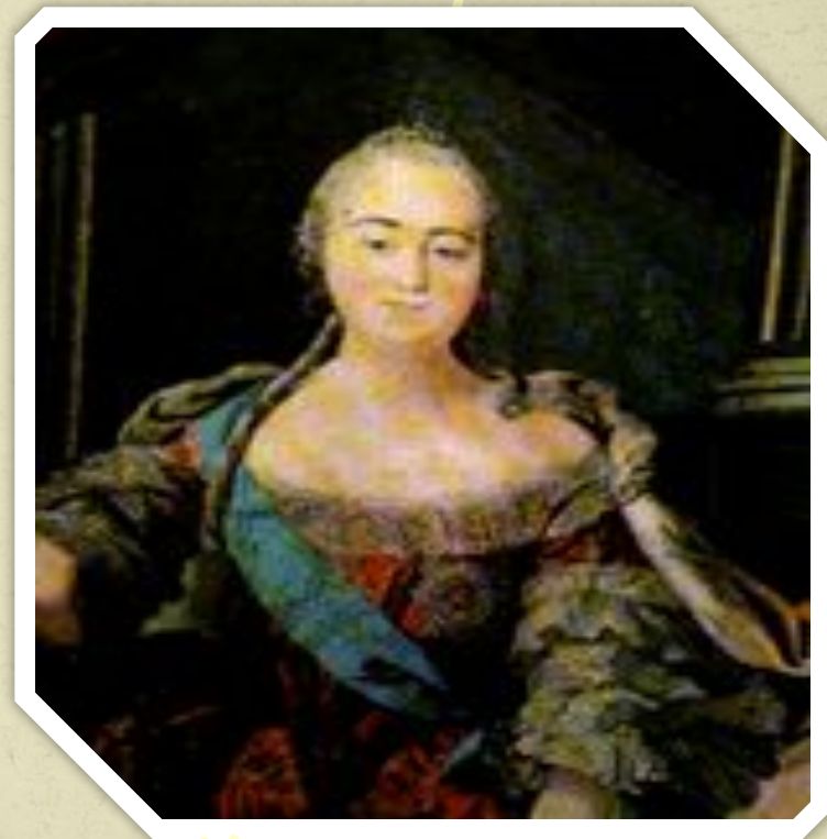
Мозаика мастерской М.В. Ломоносова