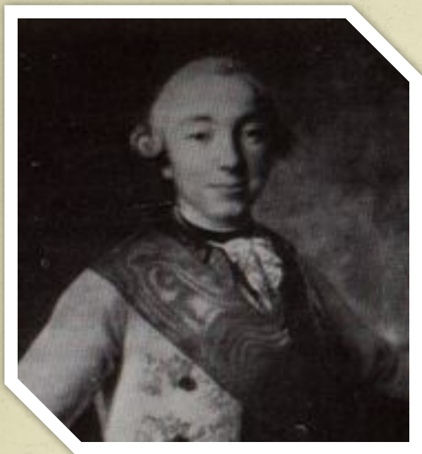
Картина Ф. Рокотова