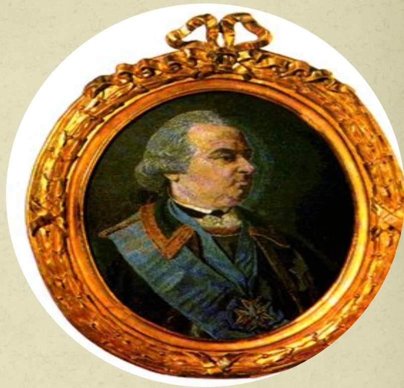
Мозаика мастерской М.В. Ломоносова