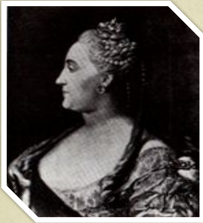
Картина Ф. Рокотова