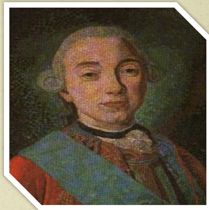
Мозаика мастерской М.В. Ломоносова