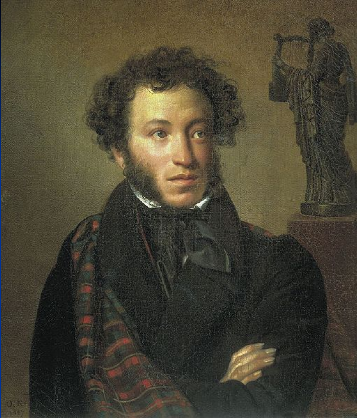
О. Кипренский «Портрет А. С. Пушкина».