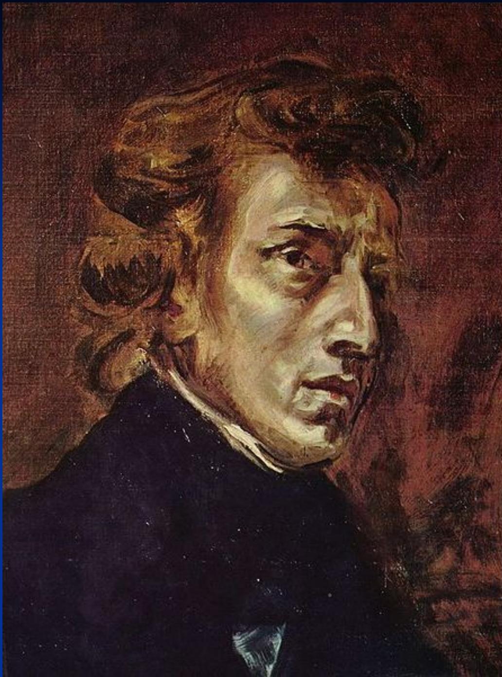
Портрет Шопена работы Эжена Делакруа, 1838