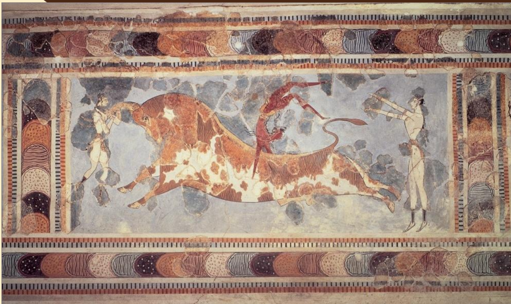
«Игра с быком». Фреска. Около 1500 г. До н.э. Археологический музей. Ираклион.