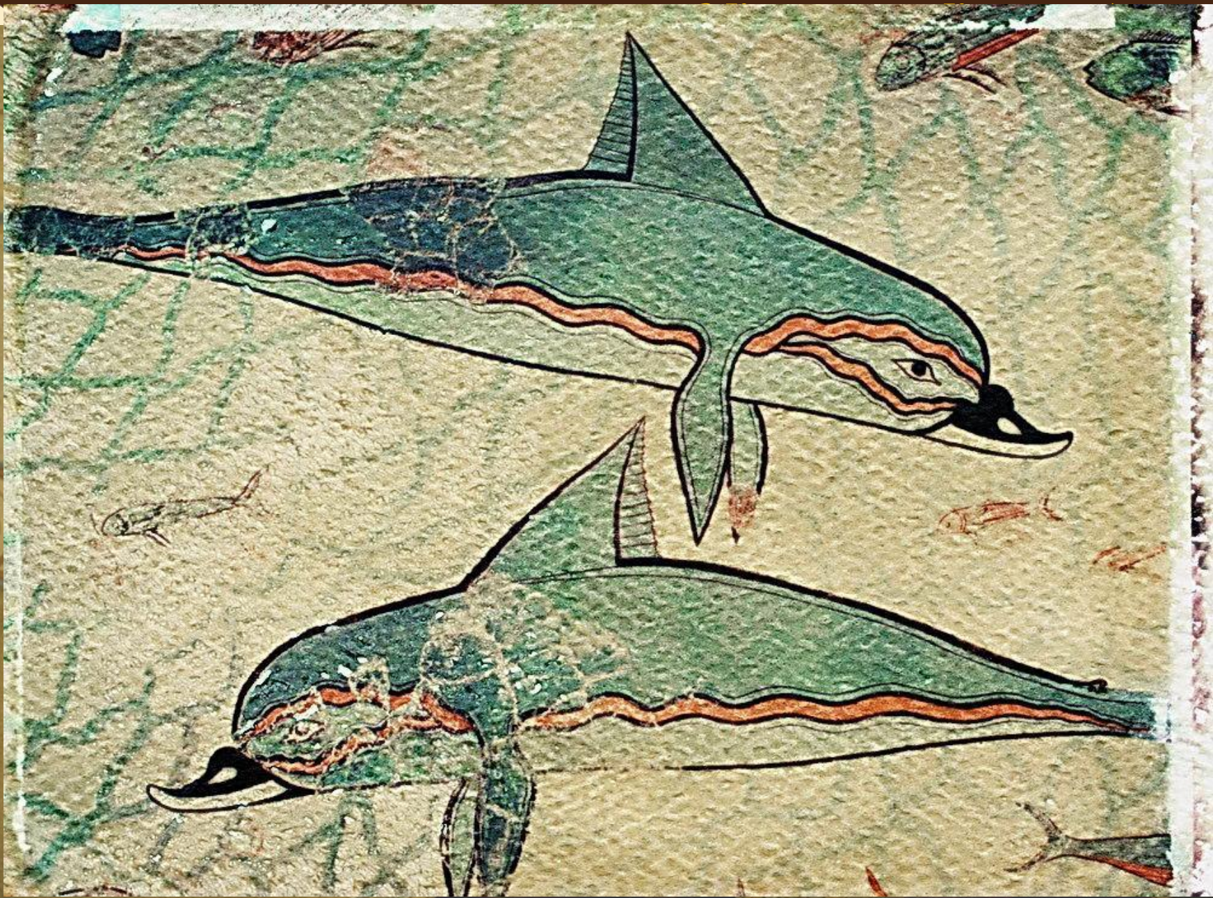
до н. э. Кносский дворец.