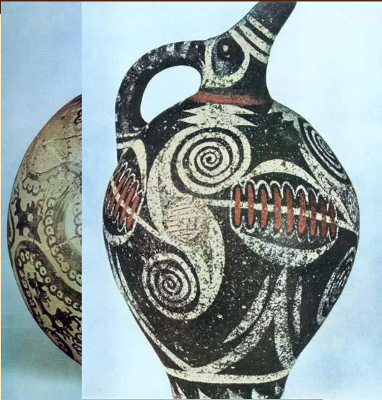
Ваза «Осьминог». около 1450 г. до н.э. Египетский музей. Ираклион.