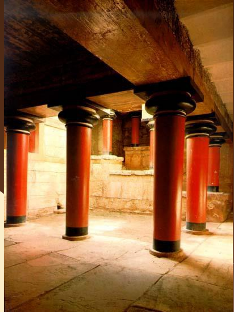
Кносский дворец. 16 век до н.э.