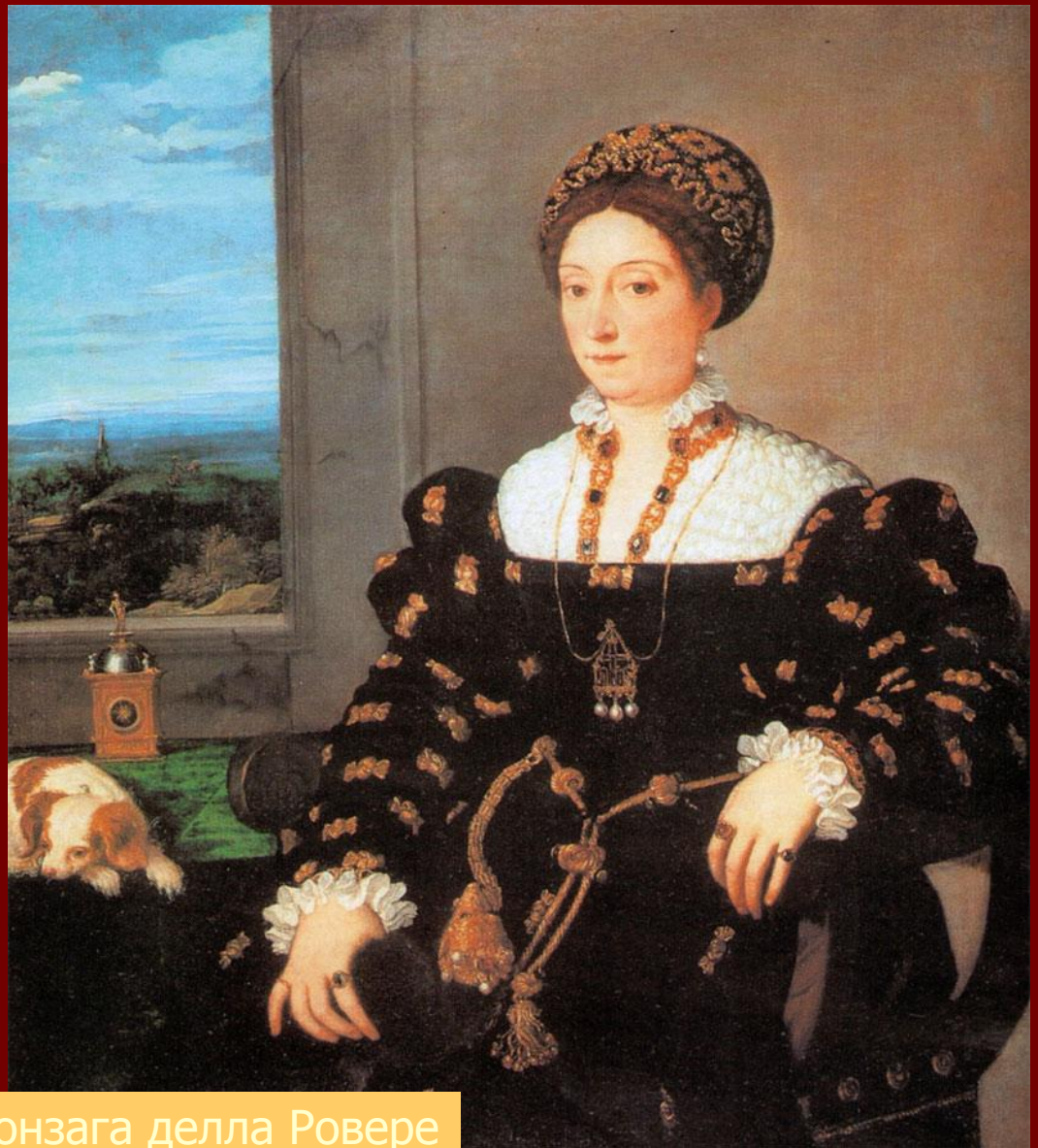
Тициан. Портрет Элеоноры Гонзага делла Ровере

В начале XIX века начинается царство кринолинов и корсетов. Самый ужасный утягивал талию и бедра и весил несколько килограммов. Конная прогулка иногда заканчивалась для дам, утягивавших талию до 55 см, летальным исходом. Врачи били тревогу, особенно после изобретения рентгеновского аппарата.