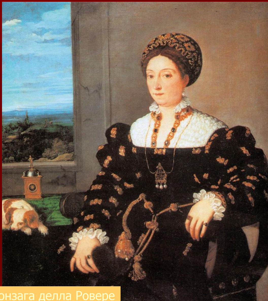
Тициан. Портрет Элеоноры Гонзага делла Ровере

В начале XIX века начинается царство кринолинов и корсетов. Самый ужасный утягивал талию и бедра и весил несколько килограммов. Конная прогулка иногда заканчивалась для дам, утягивавших талию до 55 см, летальным исходом. Врачи били тревогу, особенно после изобретения рентгеновского аппарата.