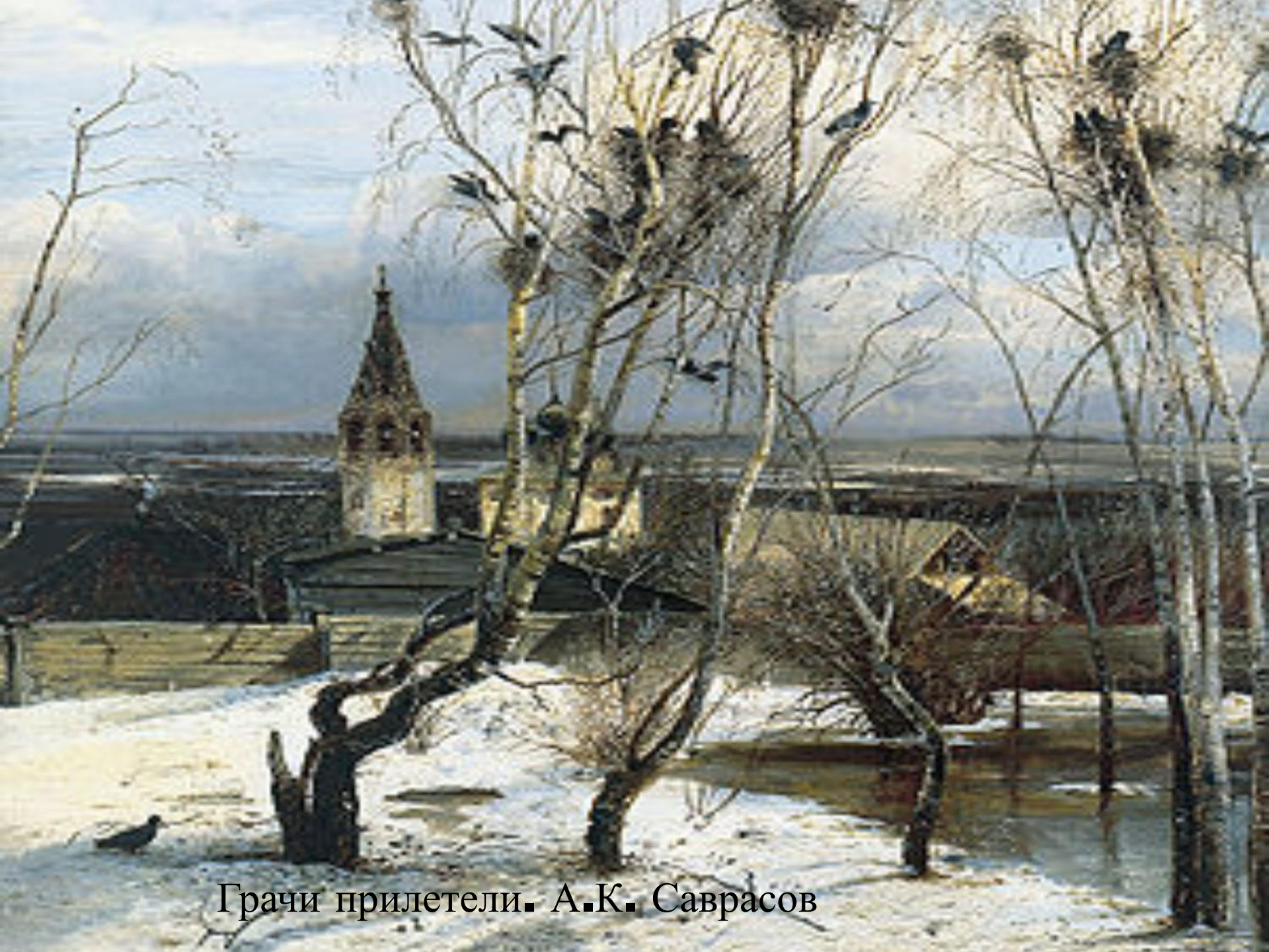
Грачи прилетели. А.К. Саврасов