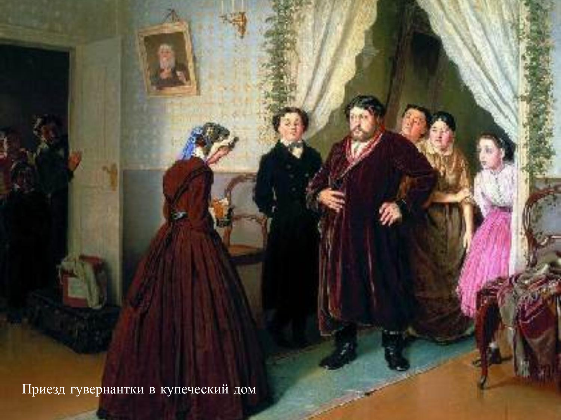
Приезд гувернантки в купеческий дом