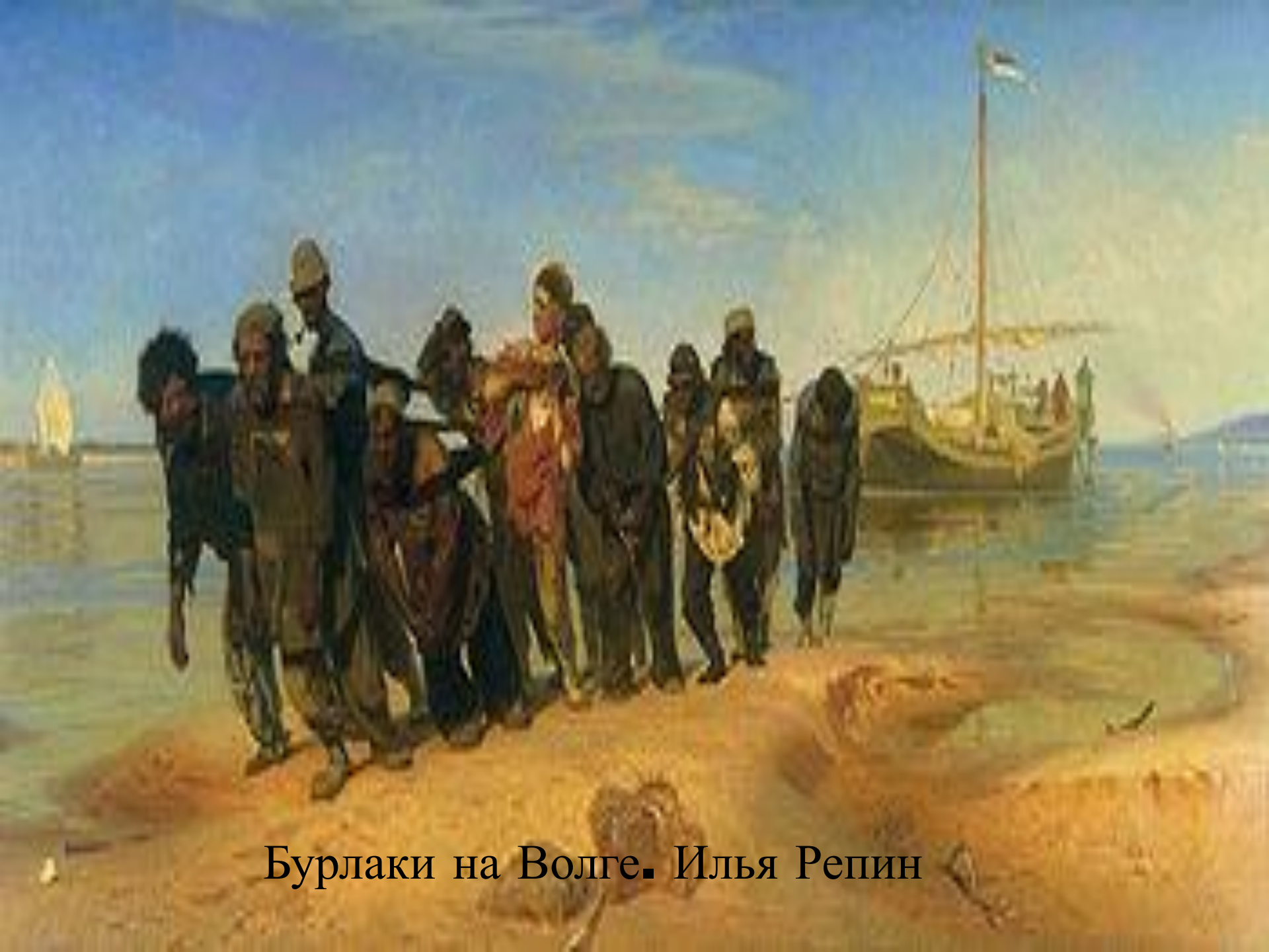
Бурлаки на Волге. Илья Репин