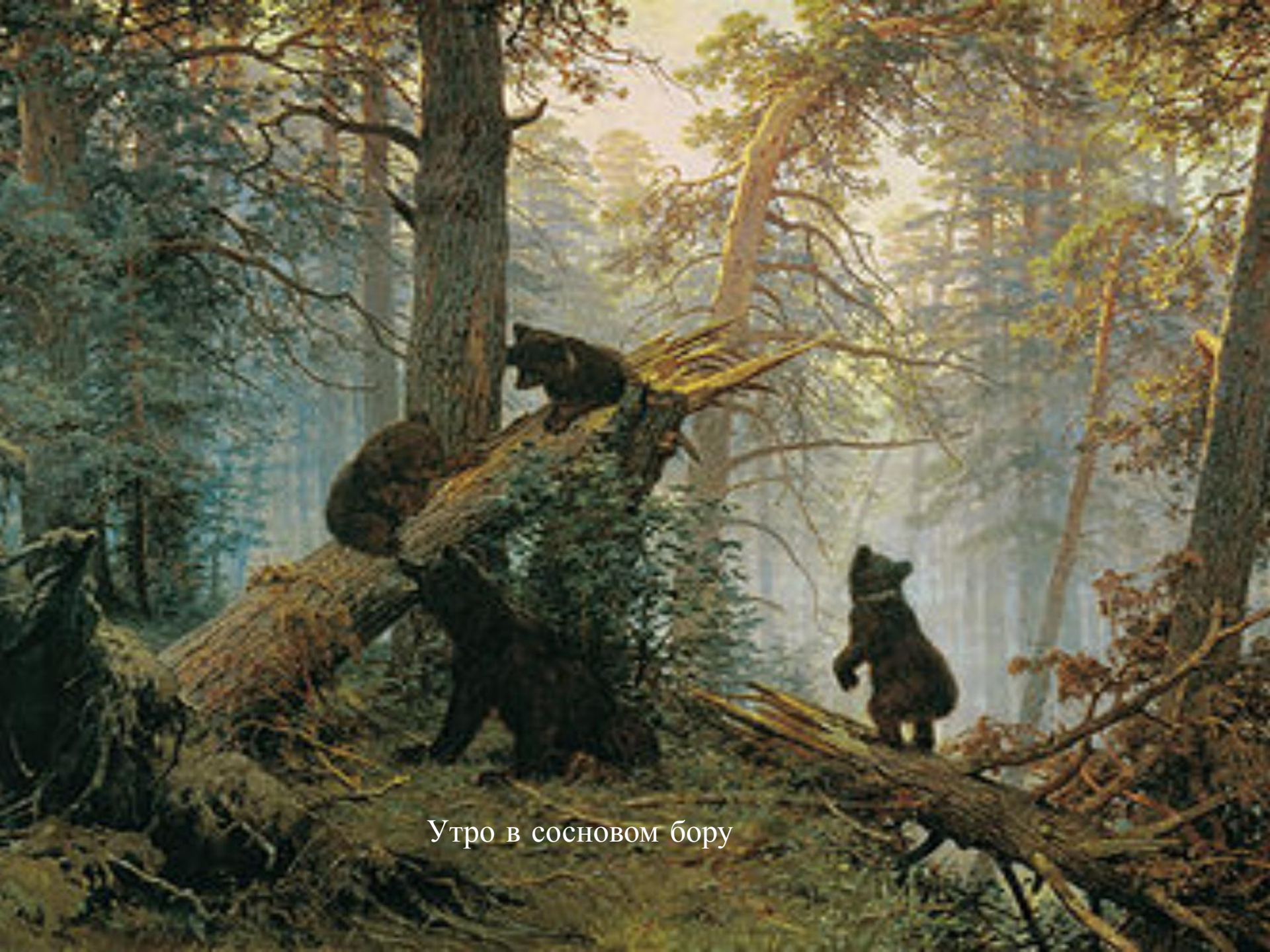
Утро в сосновом бору