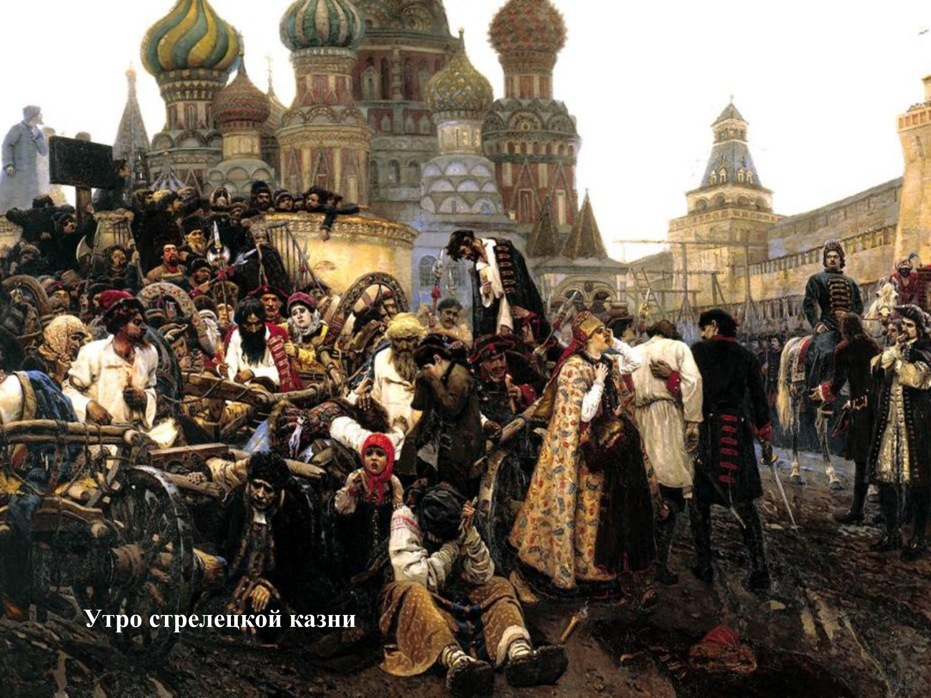
Утро стрелецкой казни