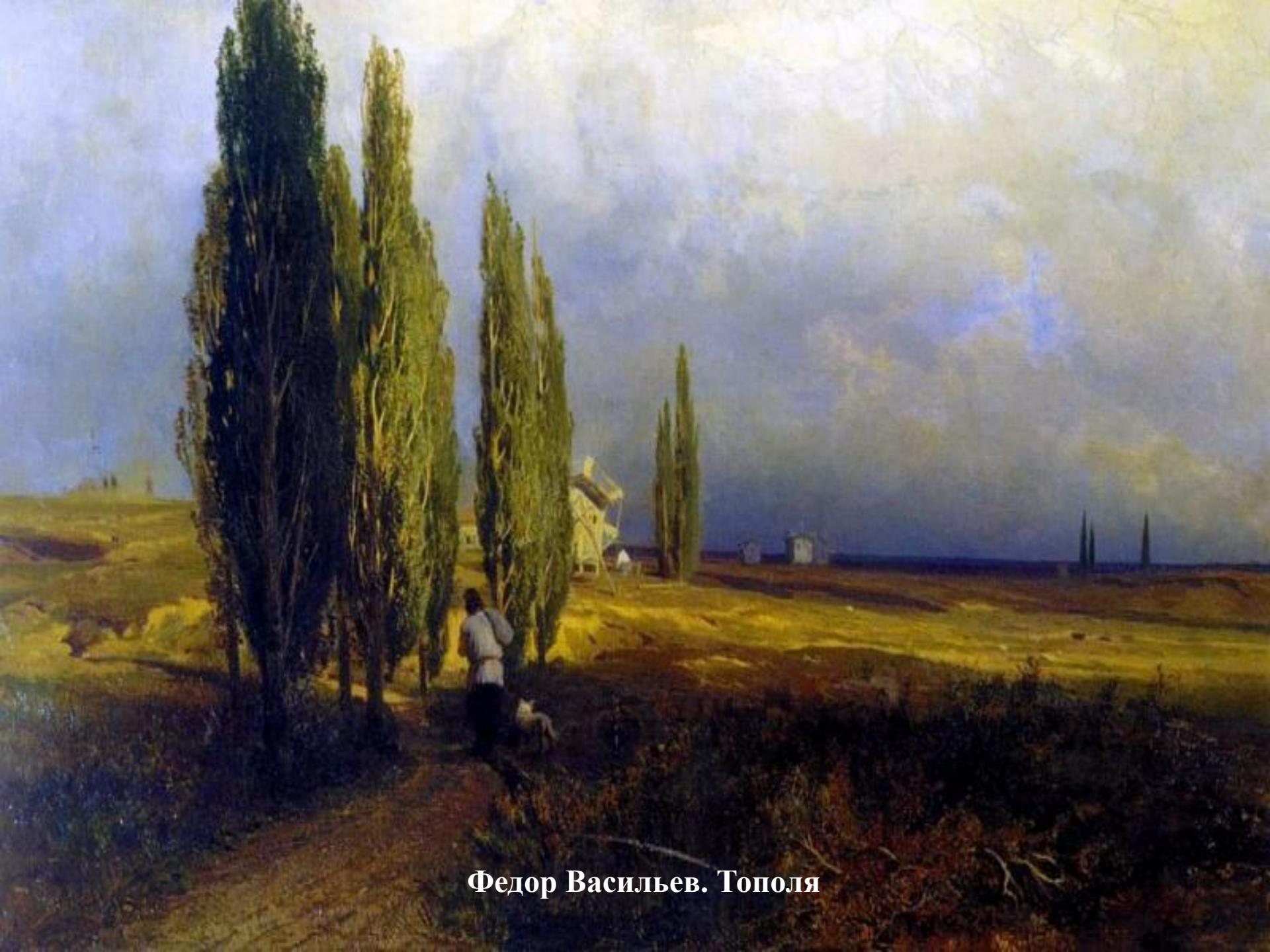
Федор Васильев. Тополя