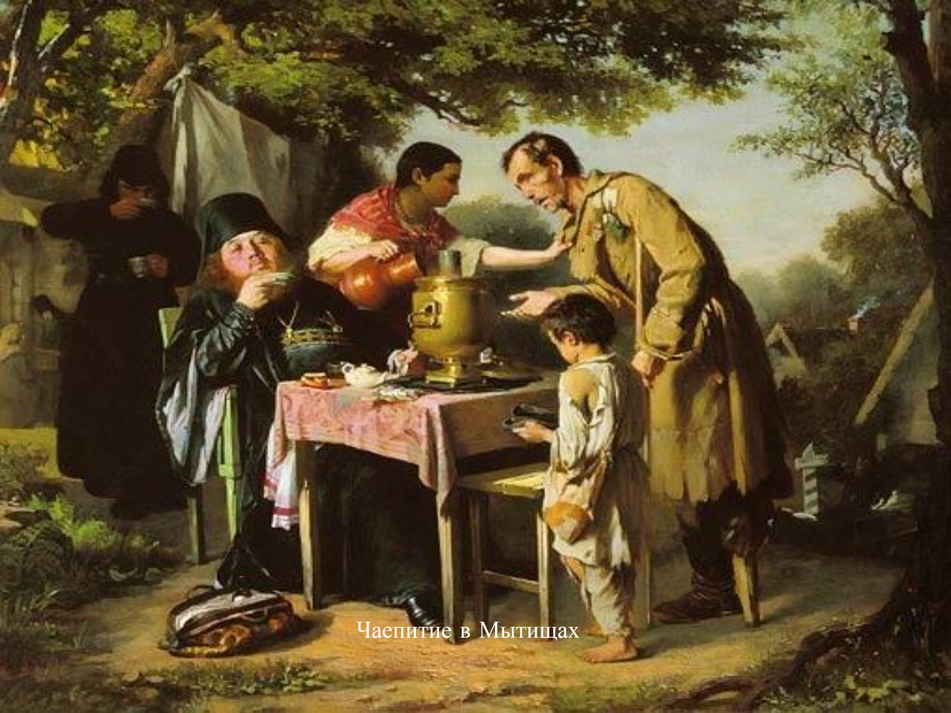
Чайпитие в Мытищах