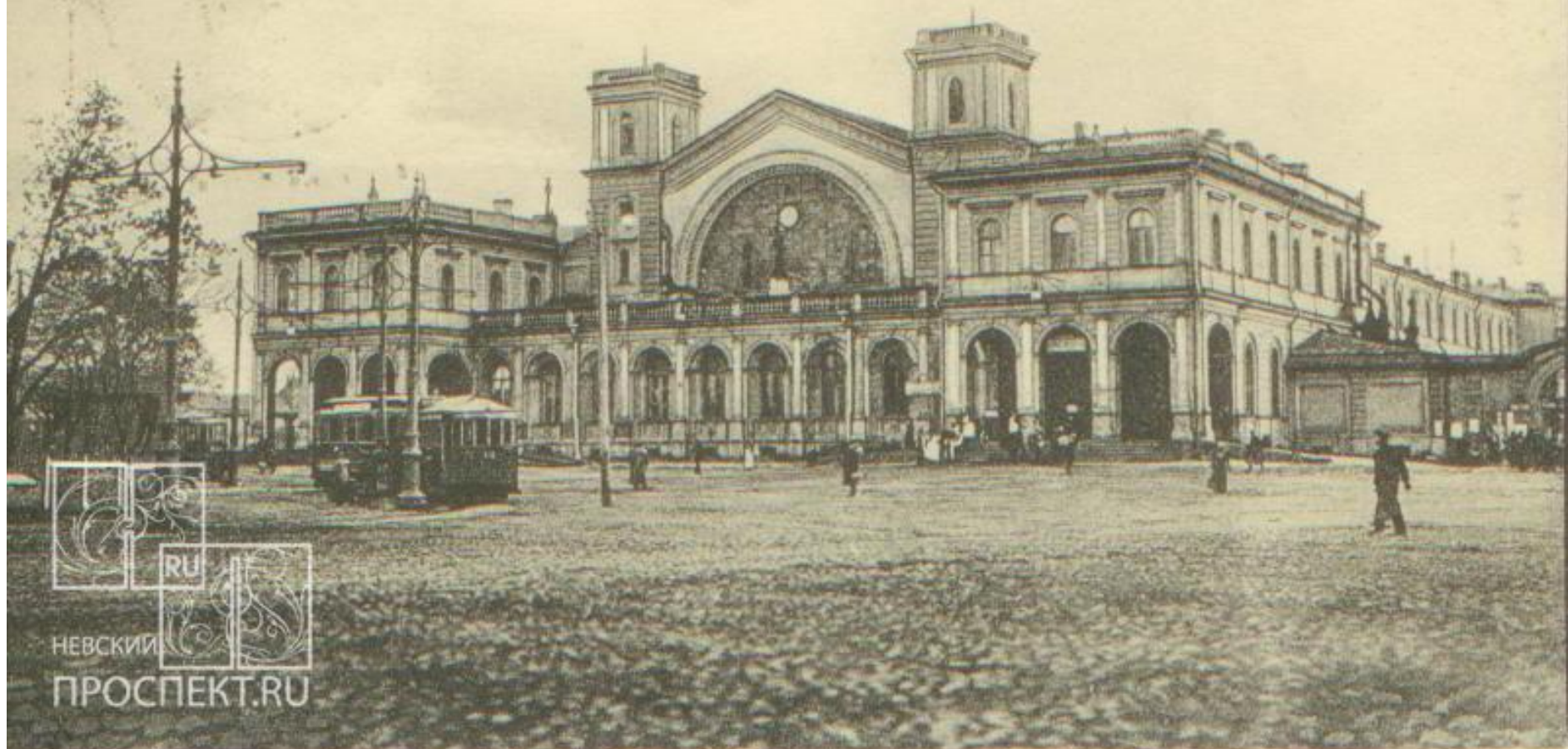
Здание Балтийского вокзала, находится на набережной Обводного канала.