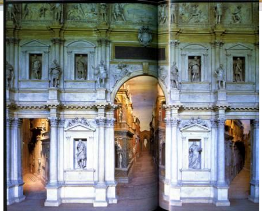
Декорации Театра Фарнезе