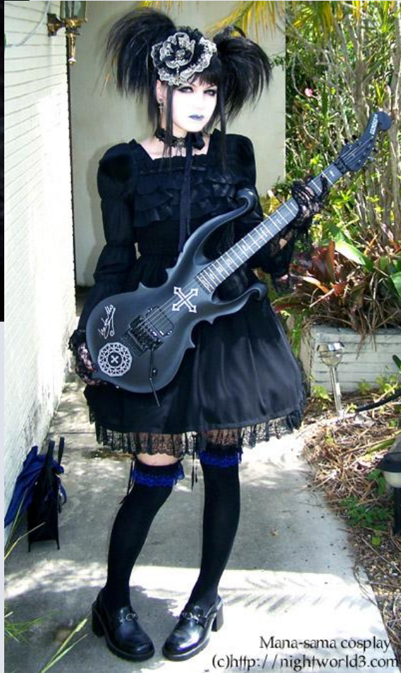
Mana-sama cosplay