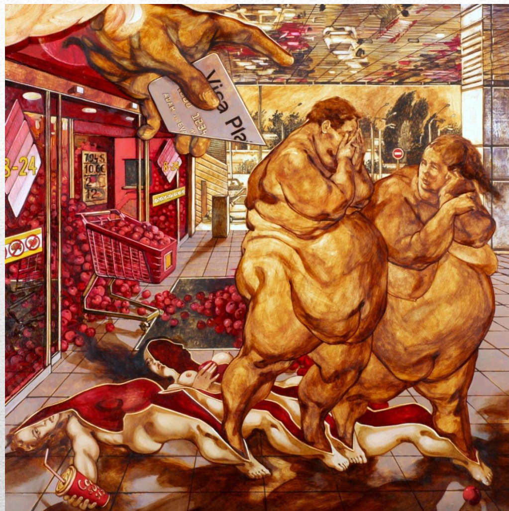
«Изгнание из рая»

«Не создавайте себе кумиров. Не потребляйте свою душу, свои жизни, как десерт к основному блюду. Берите на себя ответственность. Живите собственной жизнью».