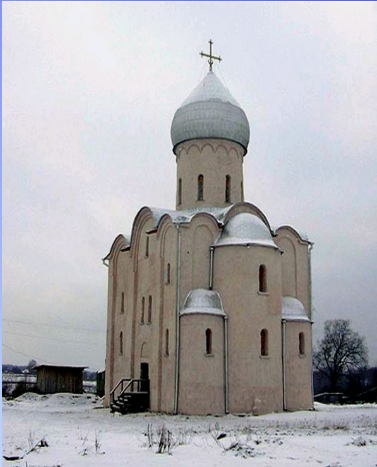
Церковь Спаса на Нередице

Каменное зодчество в Новгороде утратило свою былую монументальность. Храмы стали строить небольшими и одноглавыми. Но эта простота — очень выразительна и вписывалась в окружающий пейзаж. Все новгородские храмы возводились не по княжескому указу, а на средства бояр, купцов или прихожан.