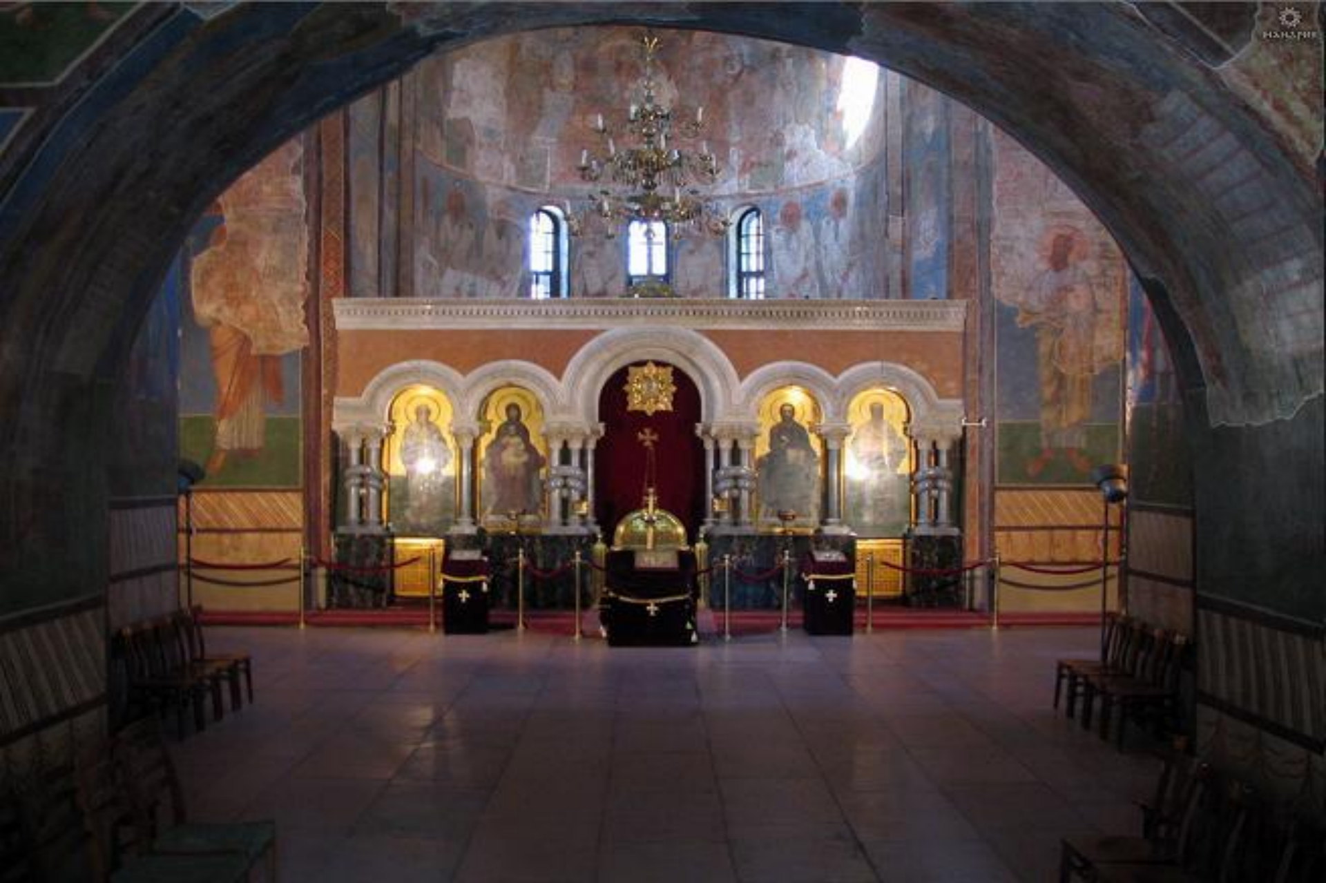
Кирилловская церковь (середина XII века) на окраине древнего Киева — Дорогожичах.