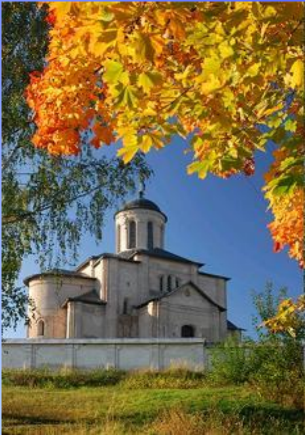
Собор Михаила Архангела в Смоленске (1191-1194)