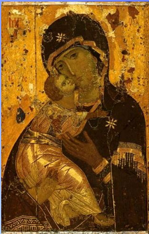
Икона «Богоматерь Владимирская»