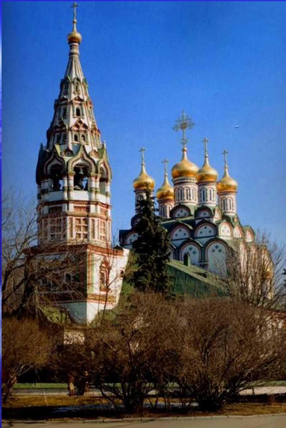
Церковь Николая в Хамовниках. XVII в. Москва.