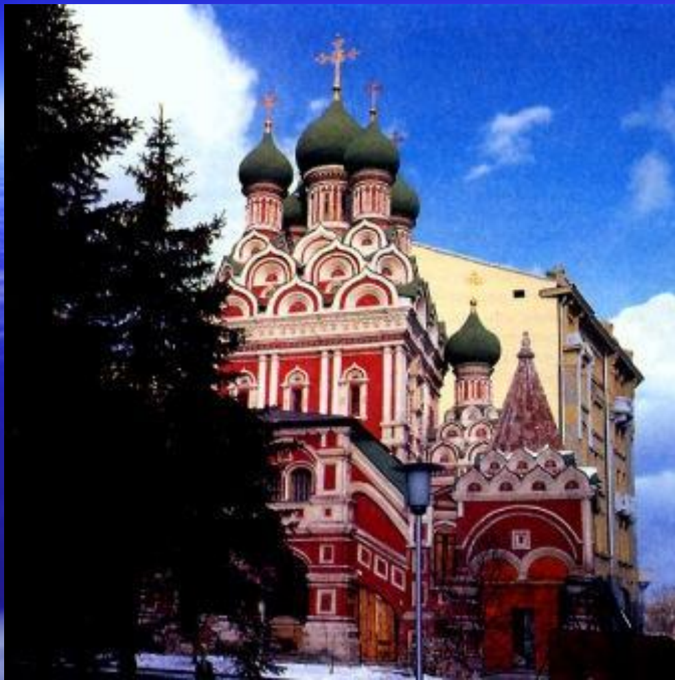
Церковь Троицы в Никитниках. 1631-1634 гг. Москва.

К уникальным сооружениям московского барокко следует отнести и церковь Троицы в Никитниках, построенную по заказу купца Григория Никитникова – выходца из Ярославля. Храм, поставленный на высоком холме в центре города, господствовал над окружающей застройкой, выделяясь сложностью силуэта. Яркая раскраска фасадов, сочная пластика белокаменного и кирпичного декора, многоцветные изразцы вместе с живописной асимметрией композиции привлекли к себе внимание горожан.