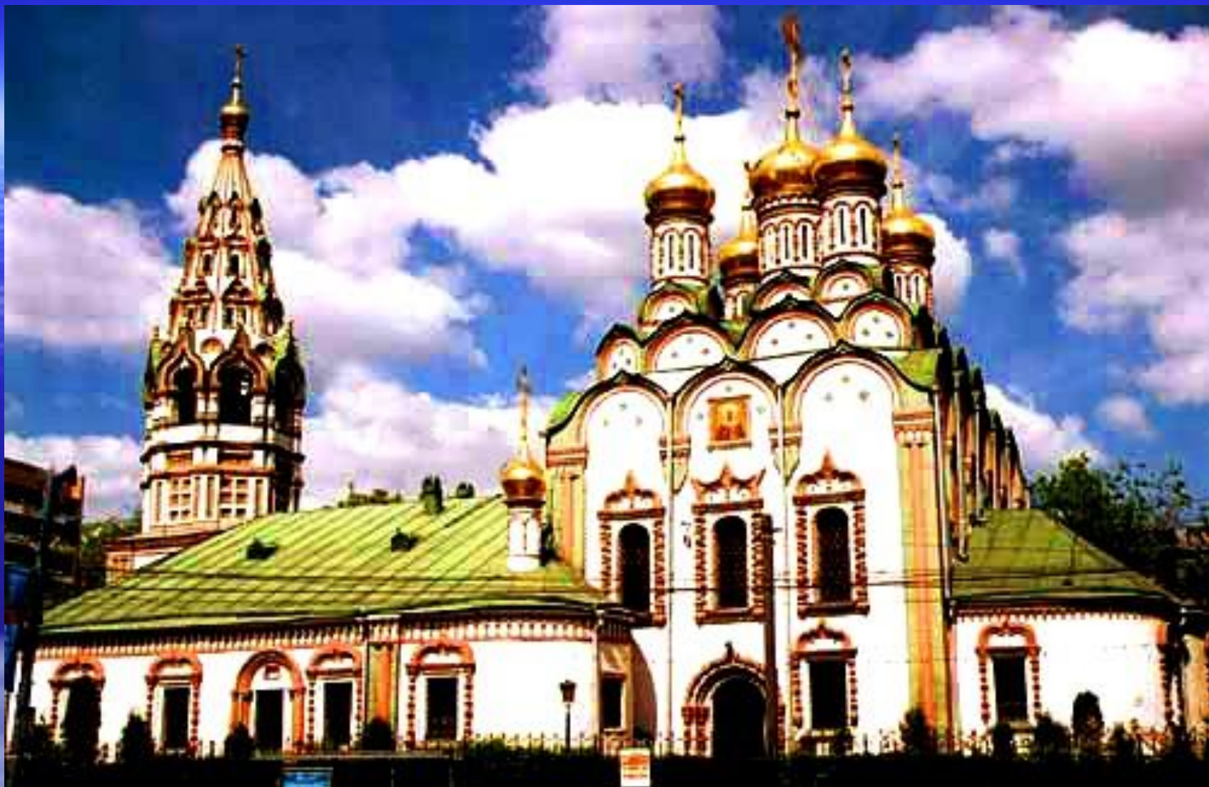
Церковь Николы в Хамовниках. XVII в. Москва.