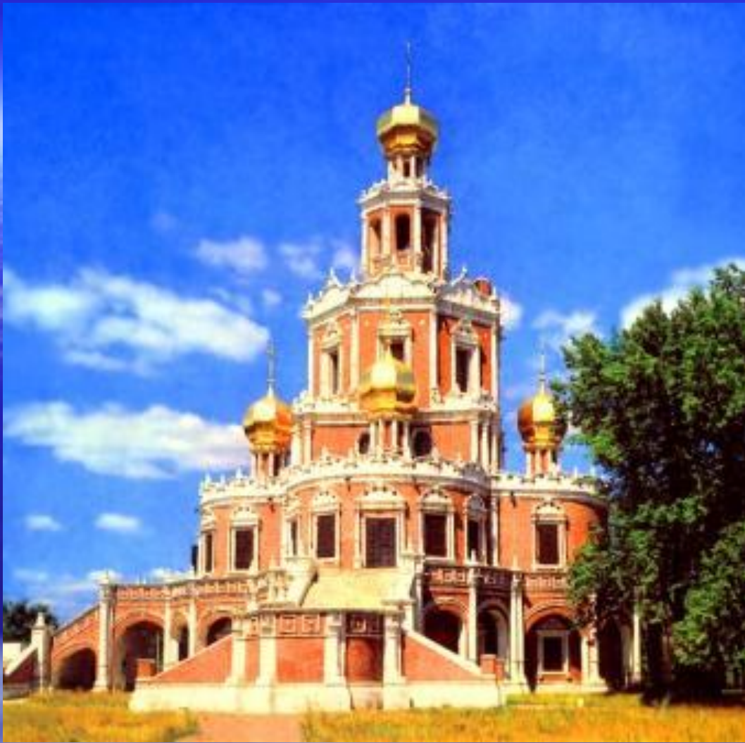
Церковь Покрова в Филях. 1693-1694. Москва.

Блестящим образцом нарышкинского барокко является церковь Покрова в Филях. Она стоит на невысоком холме, над речным берегом, повторяя себя причудливым отражением в воде. Храм имеет высокий и просторный подклет ( ПОДКЛЕТ , в русской каменной и деревянной архитектуре нижний этаж жилого дома или храма, обычно имеющий служебно-хозяйственное назначение), на арках которого расположена терраса с тремя плавными лестничными маршами. Главный объем здания окружен полукруглыми пределами, каждый из которых увенчан золотой главой. Переход от четверика к восьмиерику выполнен настолько плавно и умело, что зритель не сразу замечает смену архитектурных членений. Карниз и резные белокаменные украшения естественно продолжают тройные капители угловых колонок.