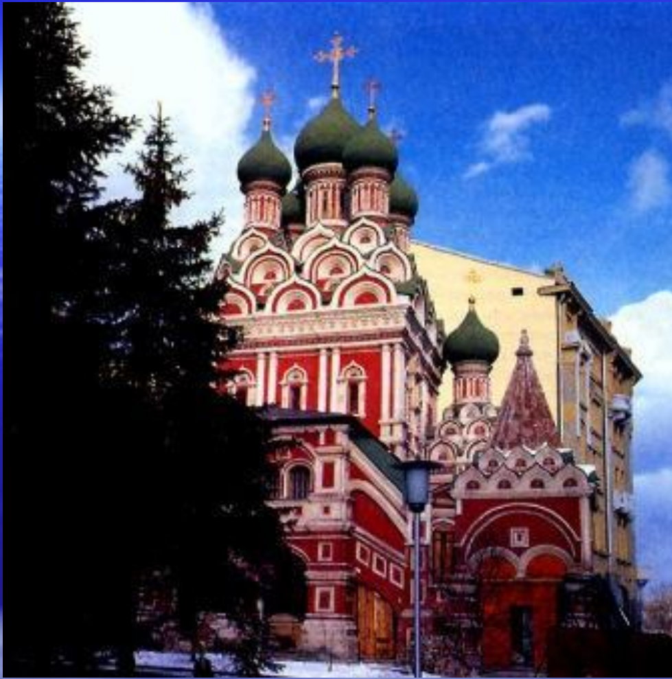
Церковь Троицы в Никитниках. 1631-1634 гг. Москва.