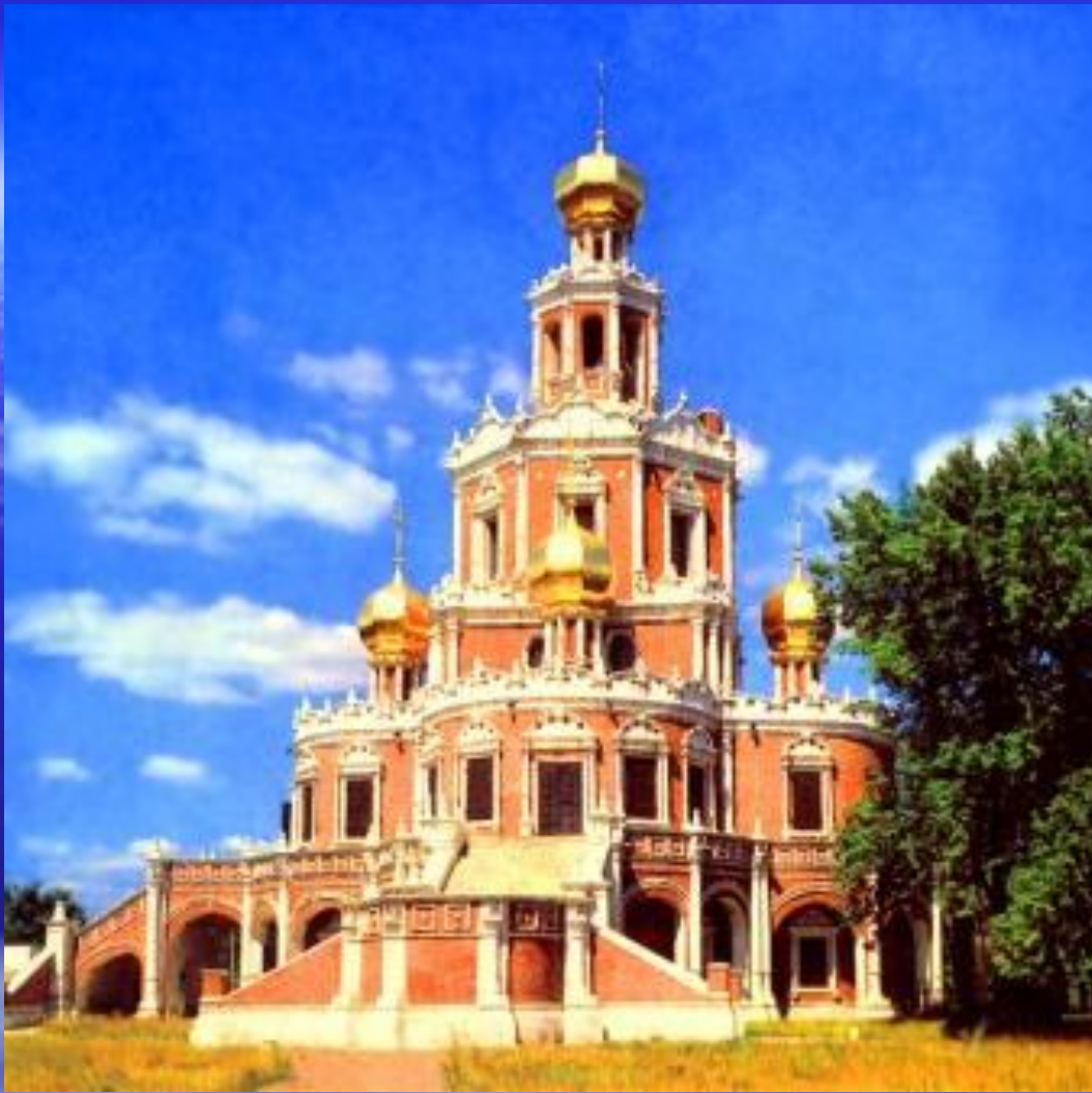
Церковь Покрова в Филях. 1693-1694. Москва.

Блестящим образцом нарышкинского барокко является церковь Покрова в Филях. Она стоит на невысоком холме, над речным берегом, повторяя себя причудливым отражением в воде. Храм имеет высокий и просторный подклет ( ПОДКЛЕТ , в русской каменной и деревянной архитектуре нижний этаж жилого дома или храма, обычно имеющий служебно-хозяйственное назначение), на арках которого расположена терраса с тремя плавными лестничными маршами. Главный объем здания окружен полукруглыми пределами, каждый из которых увенчан золотой главой. Переход от четверика к восьмернику выполнен настолько плавно и умело, что зритель не сразу замечает смену архитектурных членений. Карниз и резные белокаменные украшения естественно продолжают тройные капители угловых колонок.