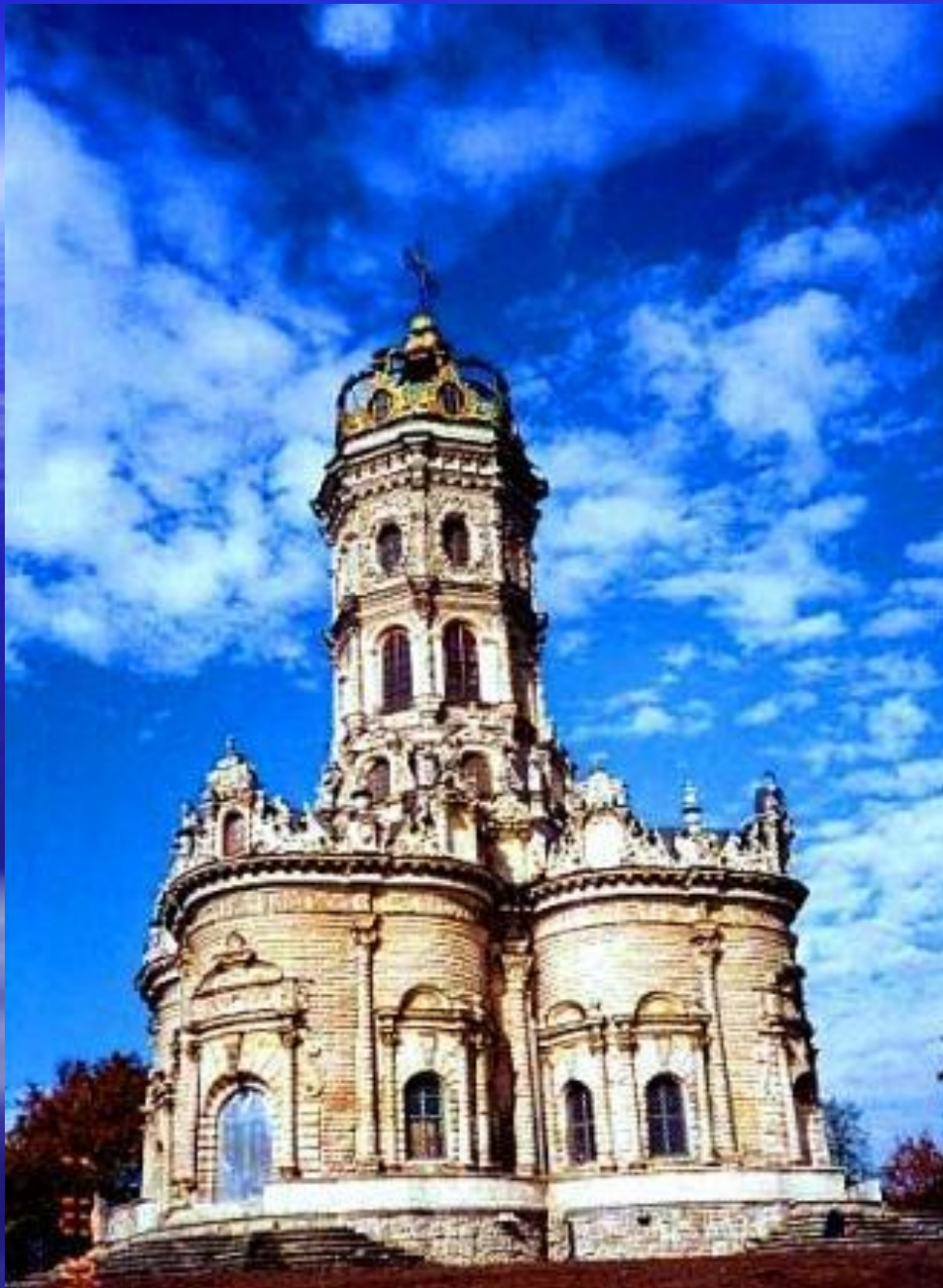
Церковь Знамения Богородицы в Дубровицах. 1690-1704. Москва.