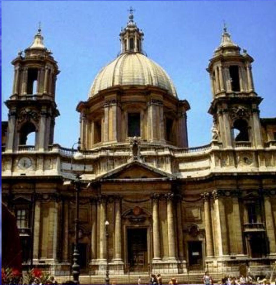
Франческо Барромини. Церковь Сант Аньезе. 1653 г. Рим.

Характерные черты итальянского барокко нашли наиболее яркое воплощение в творчестве двух зодчих, создавших целую эпоху в развитии архитектуры, - Франческо Борромини и Лоренцо Бернини.