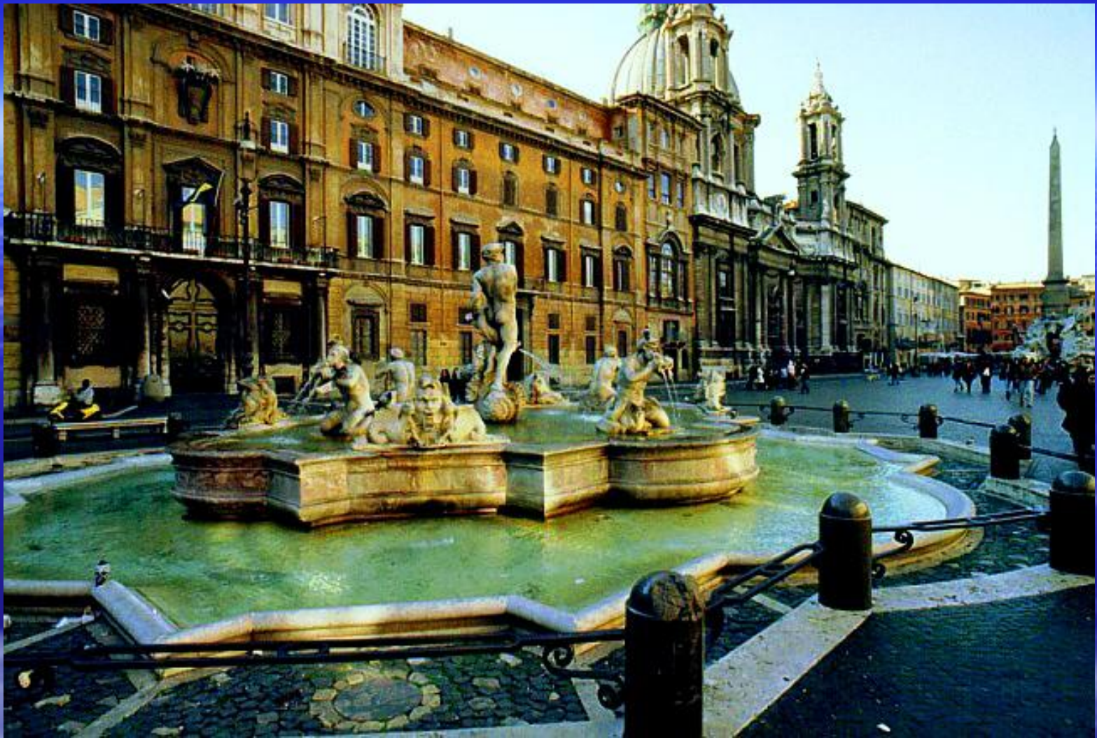
Лоренцо Бернини. Рим. Фонтан Нептуна на площади Навона.