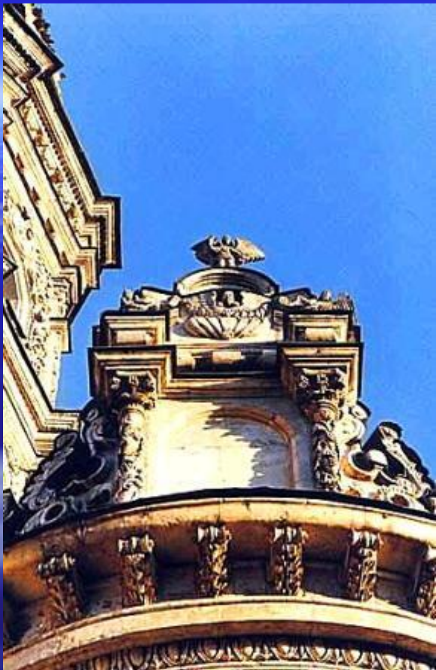
Церковь Знамени Богородицы в Дубровицах. 1690-1704. Москва.