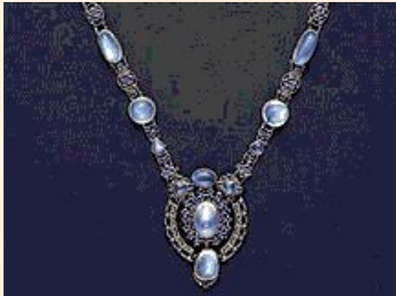
Ожерелье с кулоном. 1910. Платина, сапфиры, лунный камень.