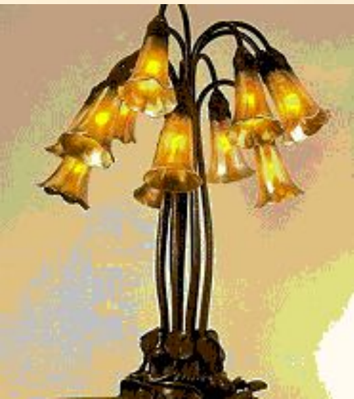
Лампа Тиффани в стиле «ар нуво», получившая название «Десять лилий»