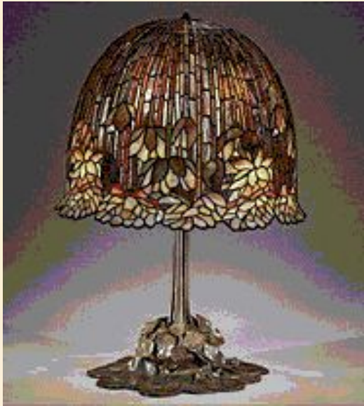
Настольная лампа «Водяные лилии» 1904-1915. Стекло фавриль, бронза.