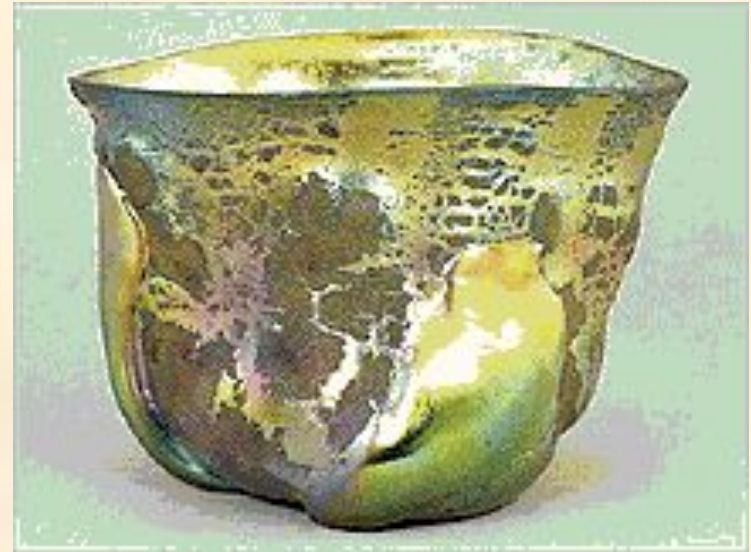
Чаша из стекла «фавриль». 1908.