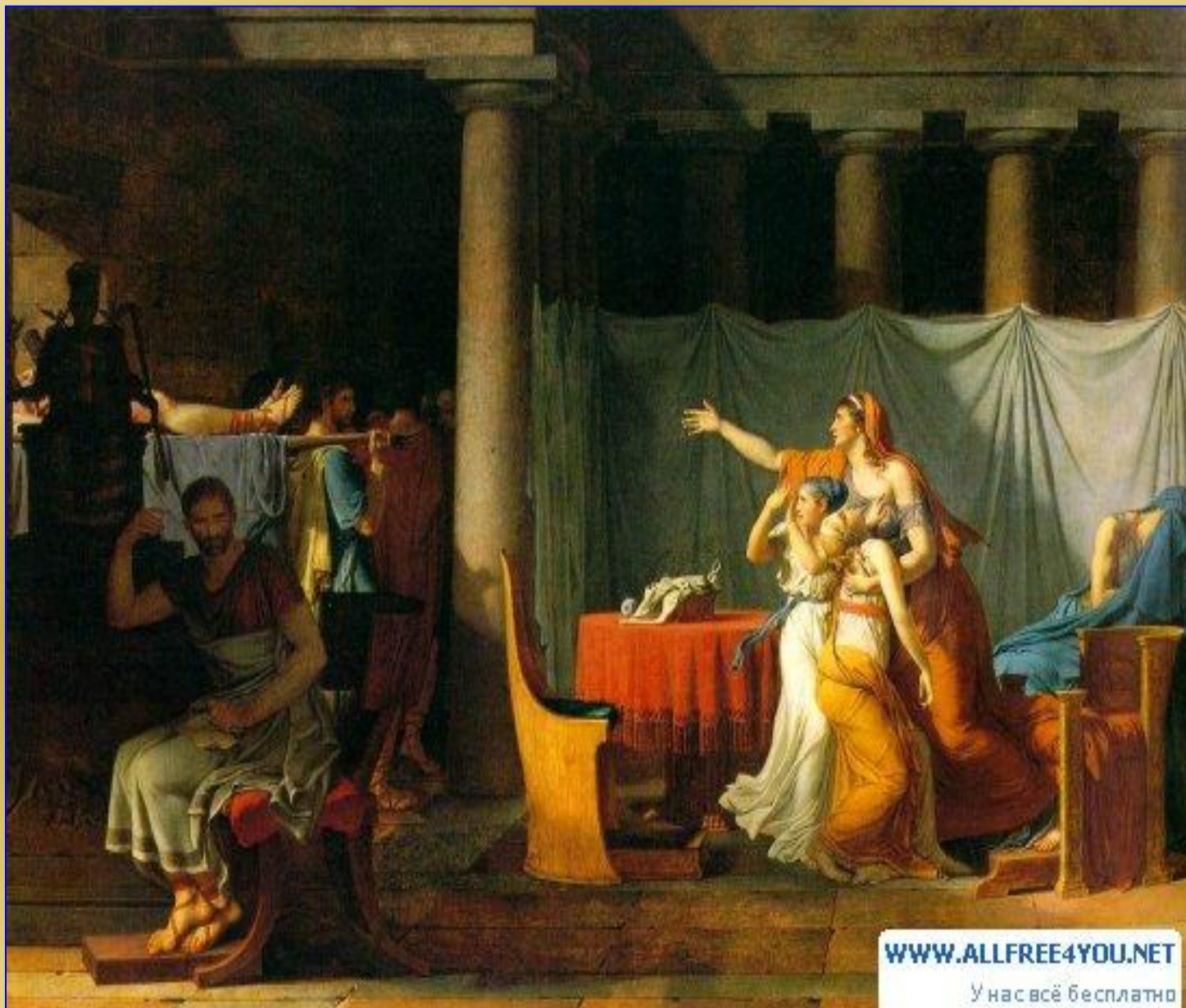
Жак Луи Давид Легионеры приносят Бруту тела казненных сыновей