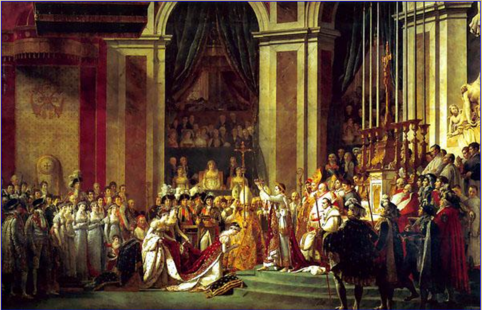
Жак-Луи Давид. Коронация императора Наполеона I и императрицы Жозефины в соборе Парижской Богоматери 2 декабря 1806 года, 1805-1807. Париж, Лувр