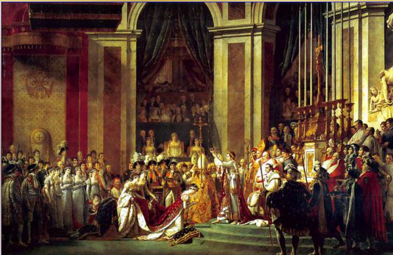
Жак-Луи Давид. Коронация императора Наполеона I и императрицы Жозефины в соборе Парижской Богородицы 2 декабря 1804 года, 1805-1807. Париж, Лувр