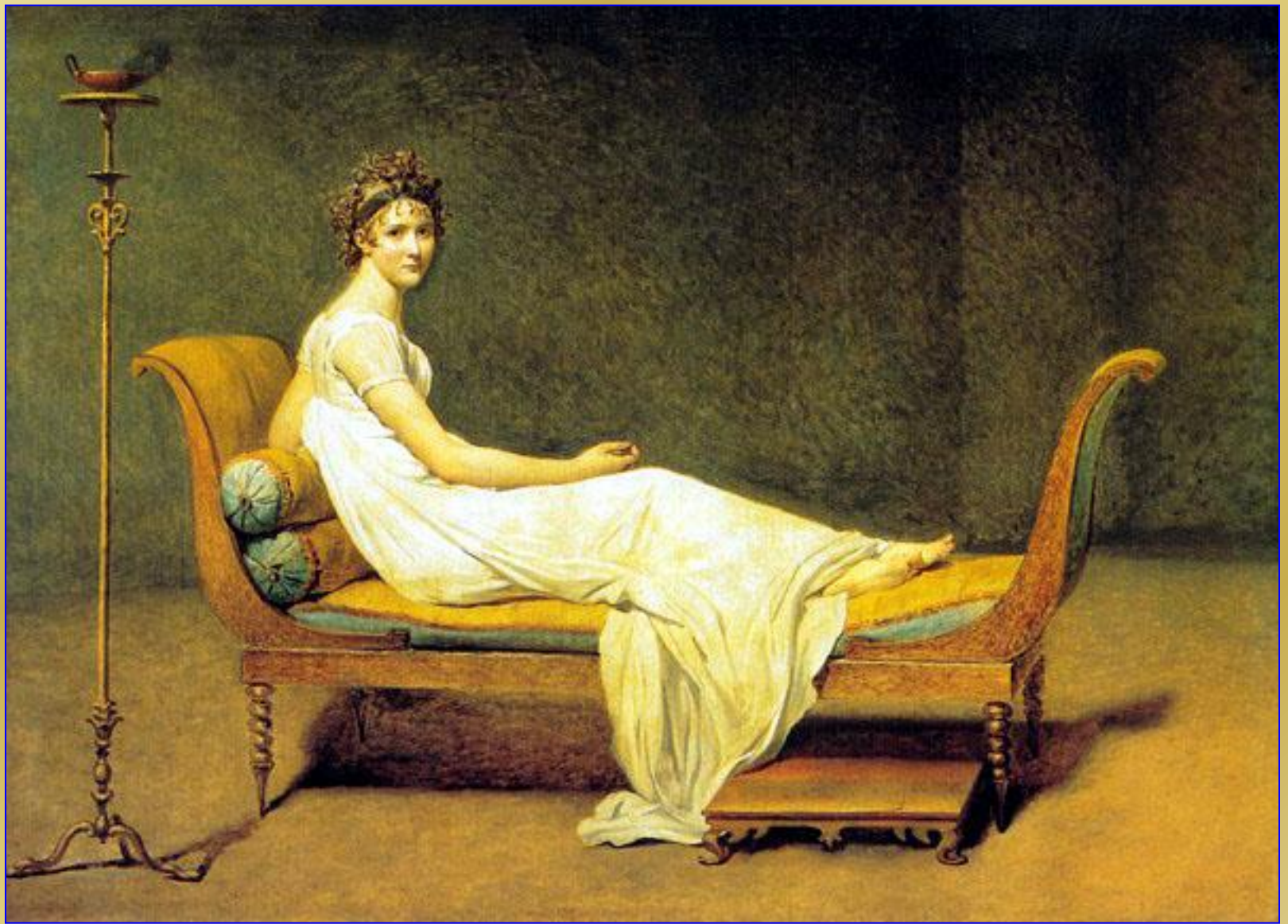
Жак-Луи Давид. Портрет мадам Рекамье, 1800. Париж, Лувр