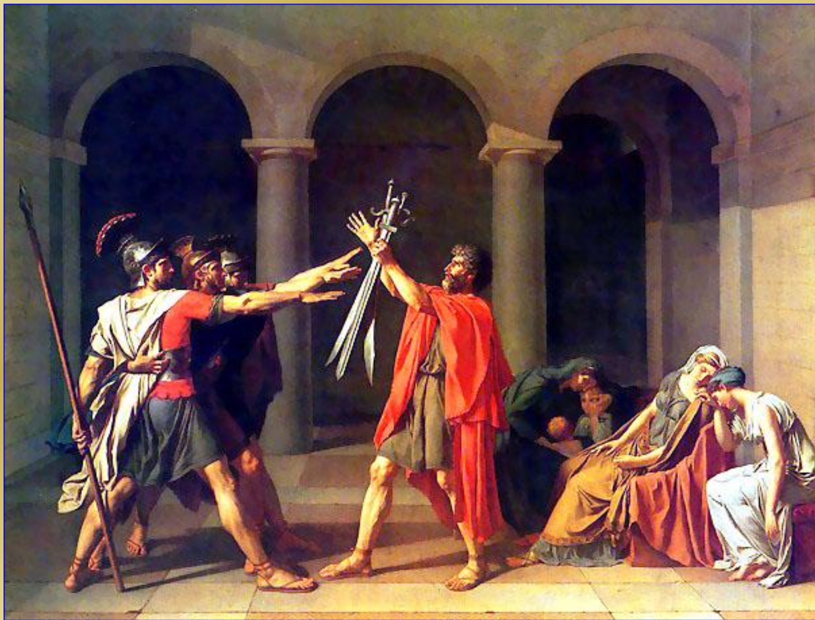
Жак-Луи Давид. Клятва Горацев, 1784. Париж, Лувр