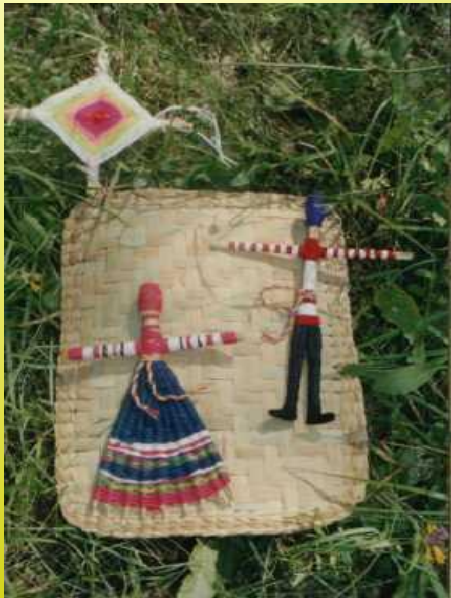
Соломенная подкова и три гушки