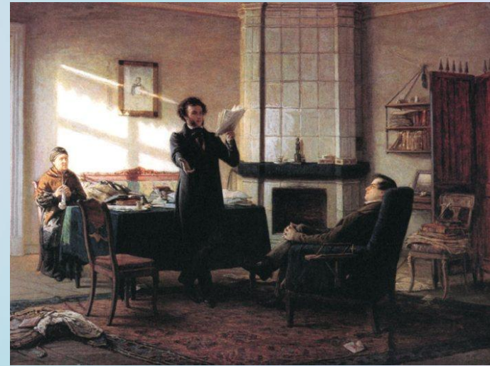
Н.Н. Ге Пушкин в селе Михайловском