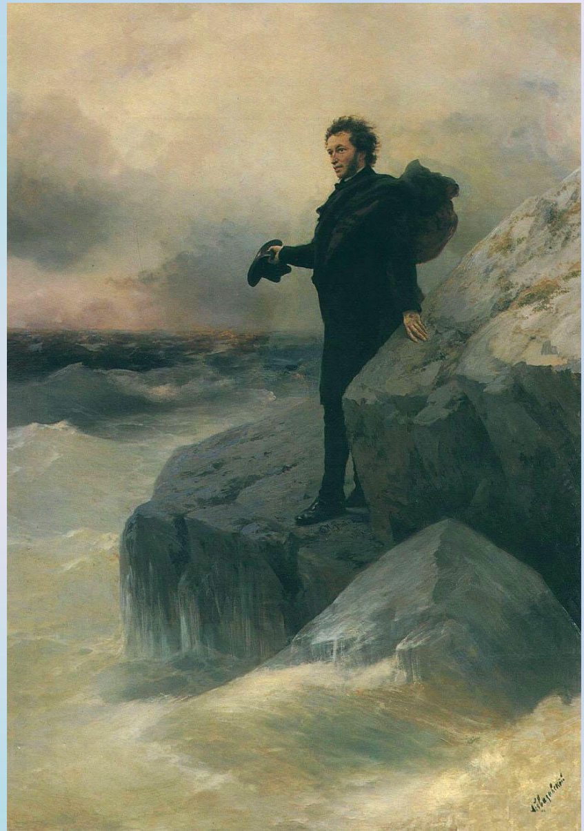
И.К. Айвазовский, И.Е. Репин "Прощание Пушкина с морем"

В леса, в пустыни молчаливы Перенесу, тобою полн, Твои скалы, твои заливы, И блеск, и тень, и говор волн