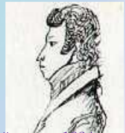
Период ссылки в Михайловское 1824 г