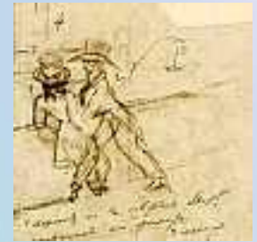
Пушкин и Онегин. Начало ноября 1824 г. Автоиллюстрация к первой главе "Евгения Онегина". Письмо к брату Льву Сергеевичу