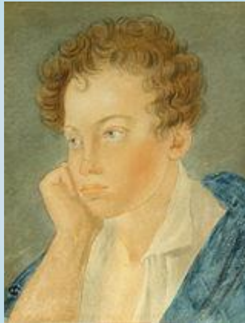
Портрет Пушкина ; Акварель С. Г. Чирикова, 1810