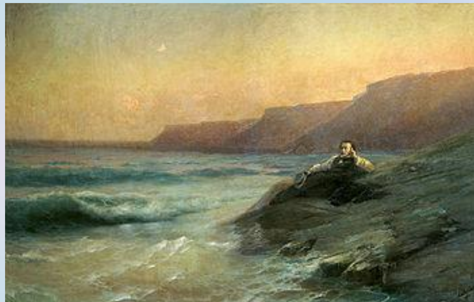
И.К. Айвазовский, "Пушкин на берегу Черного моря"

Ты катишь волны голубые И блещешь гордою красой