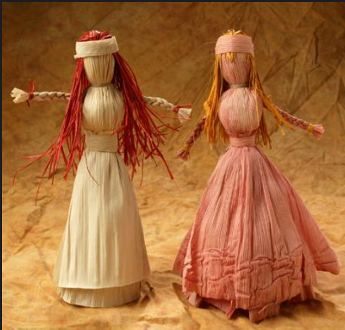
Куклы из кукурузы