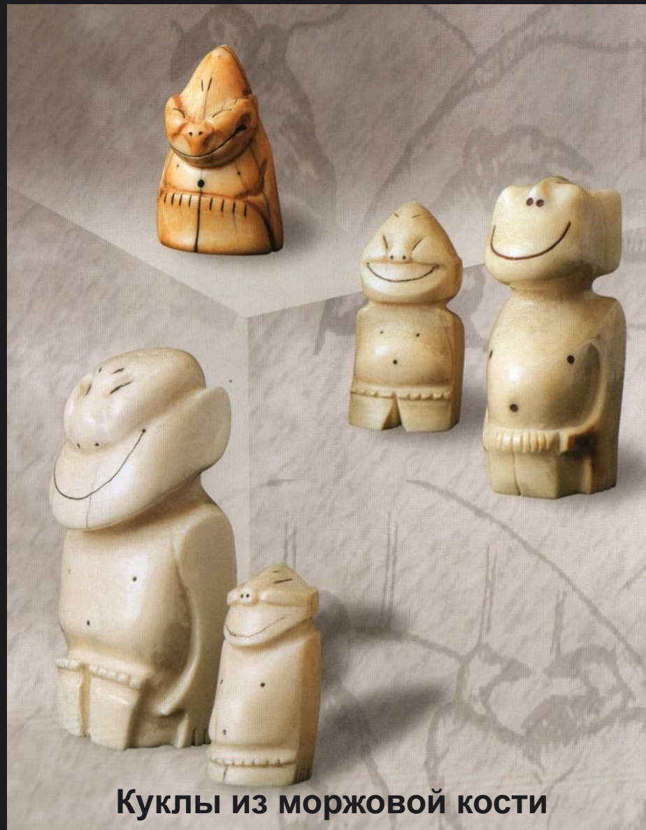
Куклы из моржовой кости