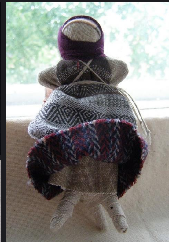
Удмуртская кукла ТРЕНОГА