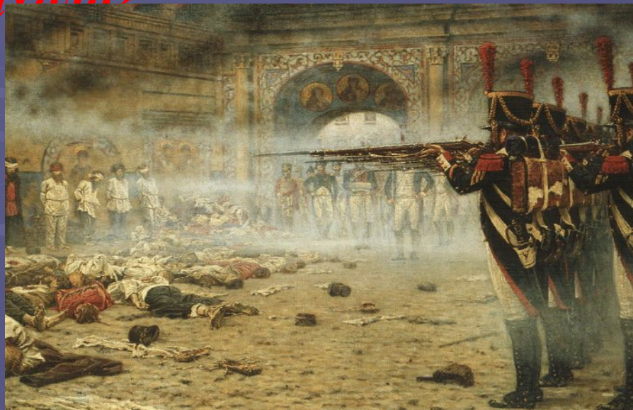
В.В.Верещагин. "Расстрел поджигателей". Из серии картин "1812 год". 1897-1898 гг.