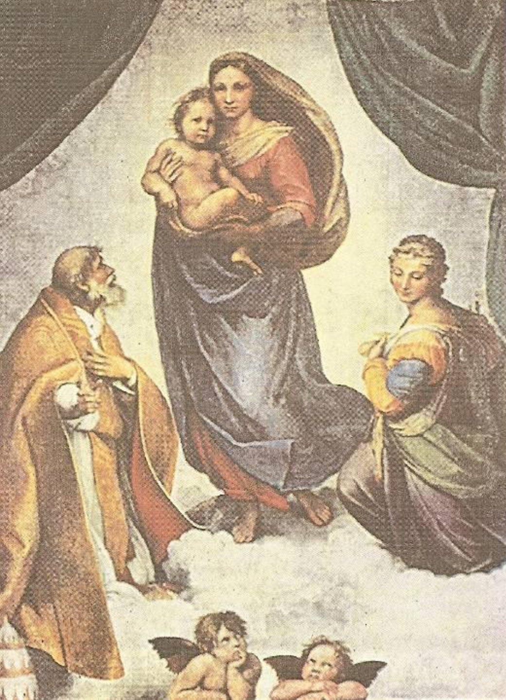
Сикстинская Мадонна. 1513 – 1514 гг.