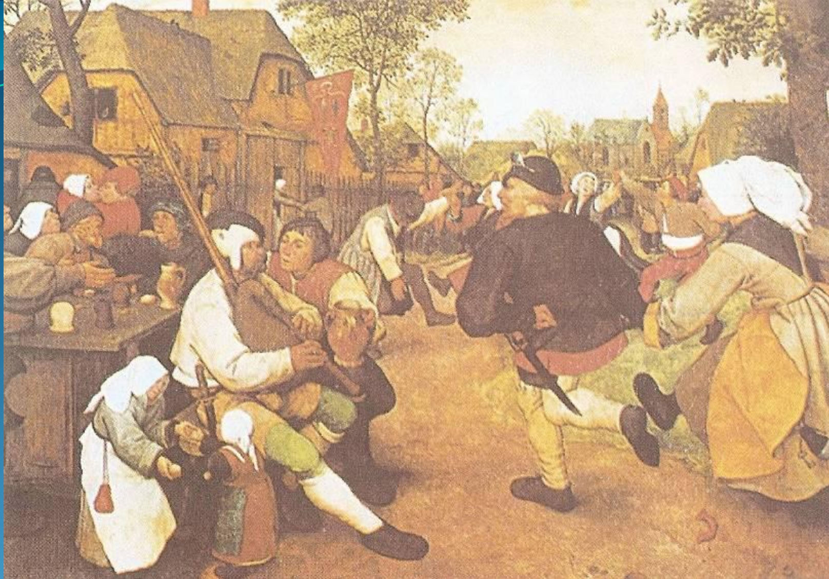
Крестьянский танец 1568 год.