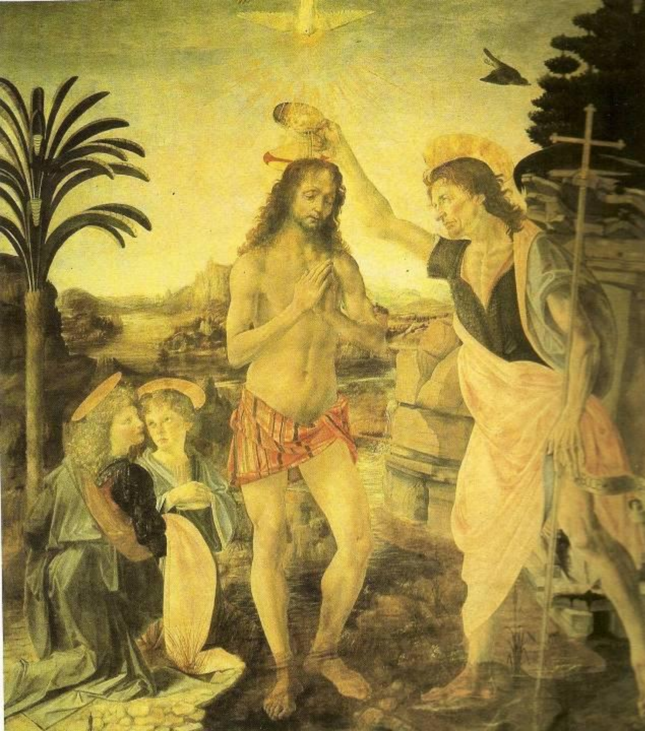
Крещение Христа 1473-1478 гг. Андреа Вероккио.